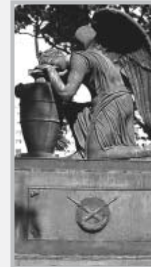
Русский скульптор И. П. Мартос (1752(1754-?)–1835). «Плачущий ангел».

На строительство собора над могилой солдата с ангелом собирали деньги у народа, днём шло строительство, но каждое утро все следы его исчезали.