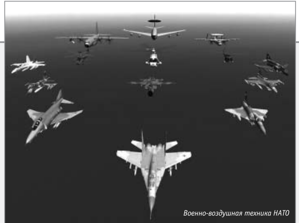
Военно-воздушная техника НАТО

По мнению многих российских политиков и ученых, униженное положение Германии не может длиться вечно. Становится все опаснее и тяжелее экономически и морально находиться на коротком поводке США и участвовать в американских глобальных приключениях. В этой связи германский политик Эгон Бар писал, что «ни один народ не может долго жить на коленях», и призвал