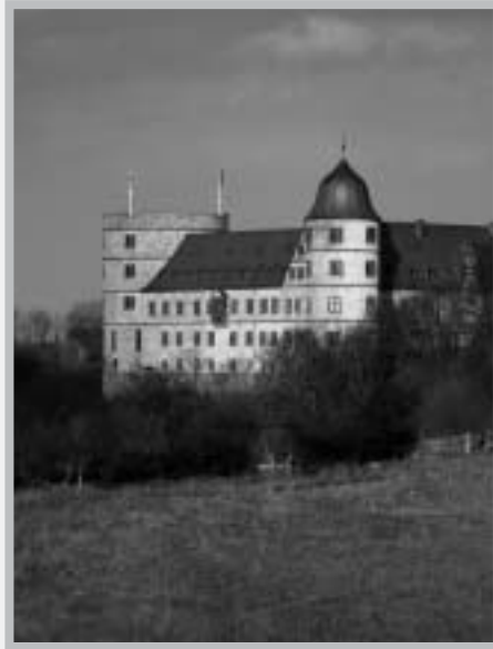
Вевельсбург, / фото П. Пеннер

Бринкман: Еще мальчишкой я хотел работать в другой Европе. Когда подростком я ездил к своим дедушке с бабушкой, я чувствовал это разделение на континенте. Юношей я мечтал о Европе без восточной и западной зон, о суверенной Европе. Но про-