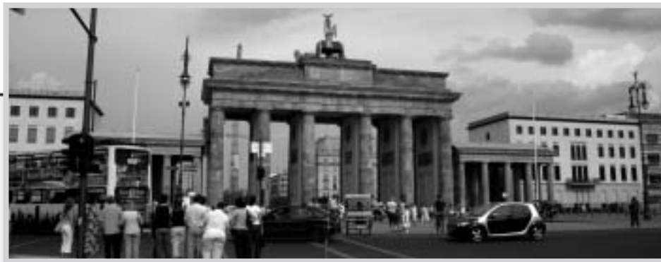
Бранденбургские ворота.

Немцам с детства внушают, что другие народы их не любят. Многие этому верят. Но последний опрос около 20 тысяч человек в 50 странах мира, целью которого