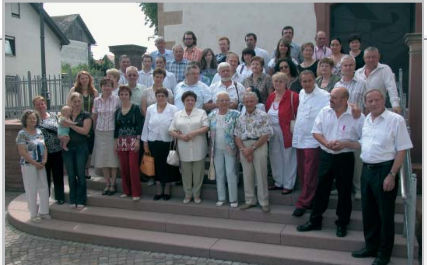
В родном селе через 200 лет

Встреча закончилась тёплым расставанием. Все вновь обретенные родственники обменялись адресами, телефонами, визитками, «имейлами». И приглашениями в гости. А через несколько дней по этим адресам и номерам потекли фотографии, письма, телефонные разговоры, вырезки из газет и журналов, «задушки»... Жизнь опять входила в свои берега, но это была уже немножко другая жизнь - более интересная, более богатая, более содержательная. Потому что Родина - это не только земля, по которой мы ходили и ходим, и скамья у каляитки, на которой сидим, но, как поётся в