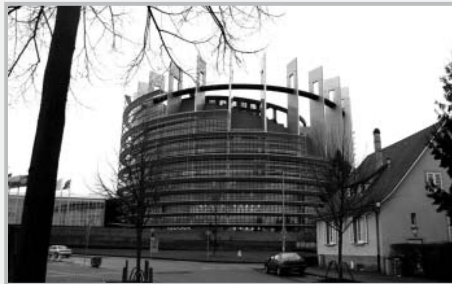
Страсбург, Европейский парламент

[ Перевод с нем.: Яволод, 2008 http://www.velesova-sloboda.org/right/brinkmann-evrosibir.html ]