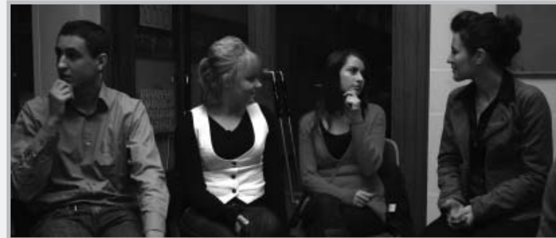
Наши дети в Германии / фото П. Пеннер

Ложь мы видим и в отношении НДПГ. С ней никто не дискутирует. Если они такие плохие, докажите, что вы для народа лучше. Но только с убедительными аргументами, а не наклеивая направо и налево ярлыки и этикетки. Таких методов мы насмотрелись при коммунистической диктатуре, и у нас к ним полный иммунитет. Просто не готовы вы с ними дискутировать. В 2000 году в телевизионной дискуссии Йорг Хайдер и