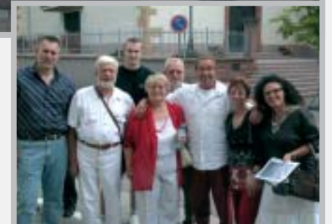
Гайгеры: от омских до берлинских