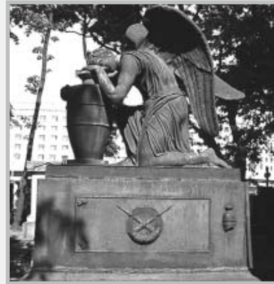
Русский скульптор И. П. Мартос (1752(1754-?) - 1835). «Плачущий ангел».

Через некоторое время президента стали искать. Его хэнди был включен, но он не отзывался. Его личная охрана забеспокоилась. Перекрыли