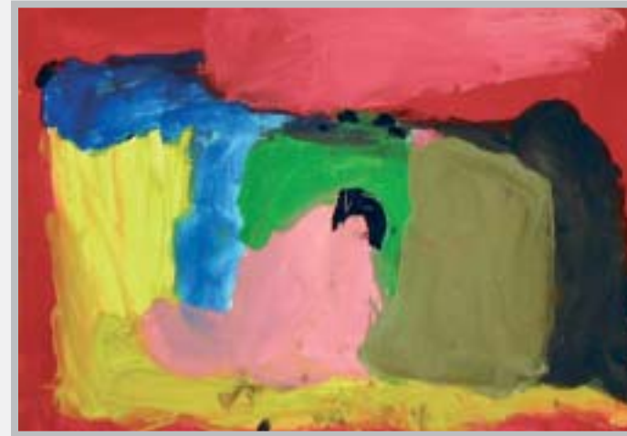
3. Дженнифер (5 лет): «Импрессион». Бумага, гуашь.

В этой работе девочка обратила внимание, что жидкая краска стекала по наклоненной бумаге, и тут же появились два человечка с зонтиком. Она сама это «увидела» в буйных разливах гуашевых потоков и сама обработала намечающийся сюжет.