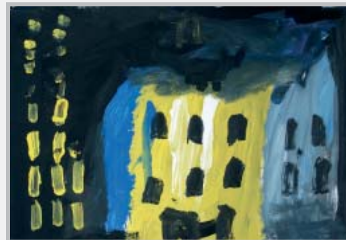
5. Алекс (5 лет): «Ночной город». Бумага, гуашь.