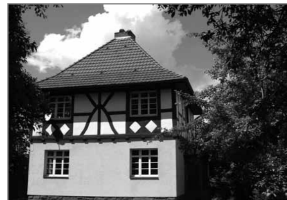
Один из декоративных элементов фахверка

Многие городские администрации считают престижным иметь улицы старинных фахверков, чтобы попасть в архитектурно-этнографический маршрут «Deutsche Fachwerkstraße», протянувшийся на 2.800 км от устья Эльбы до Боденского озера. Входят в