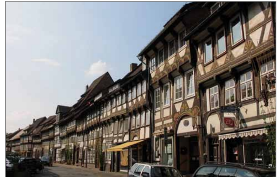
Улица фахверков в г. Einbeck (Harz)