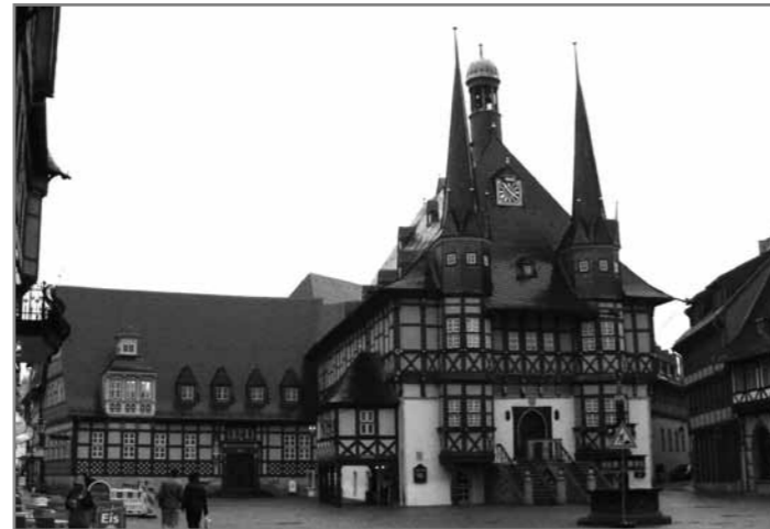
Ратуша в г. Wernigerode (Harz)

него около 100 городов шести федеральных земель. Девиз этого объединения, «Fachwerk verbindet», вызывает опасение, что «мультикультурные» и левачие силы увидят в нем «правую опасность» и навесят националистический ярлык и на любителей фахверков.