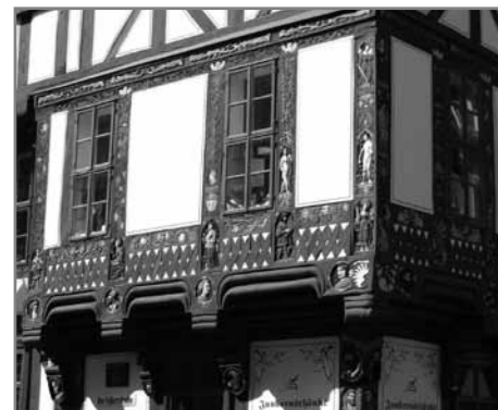
Деревянная резьба на фахверке в Göttingen'e

Сохранились и в нашем городе фахверки в несколько этажей, датированные 17 веком. Удивило, что верхние этажи нередко выступают над нижним на 40-50 см. Казалось бы, устойчивость здания требует обратного, но считается, что уступы защищают несущие стены нижнего этажа от дождей. Один знакомый энтузиаст, взявшийся реставрировать (частично на казенные деньги) небольшой везерский фахверк, на мой недоуменный вопрос ответил, что выступы эти - уловка рас-