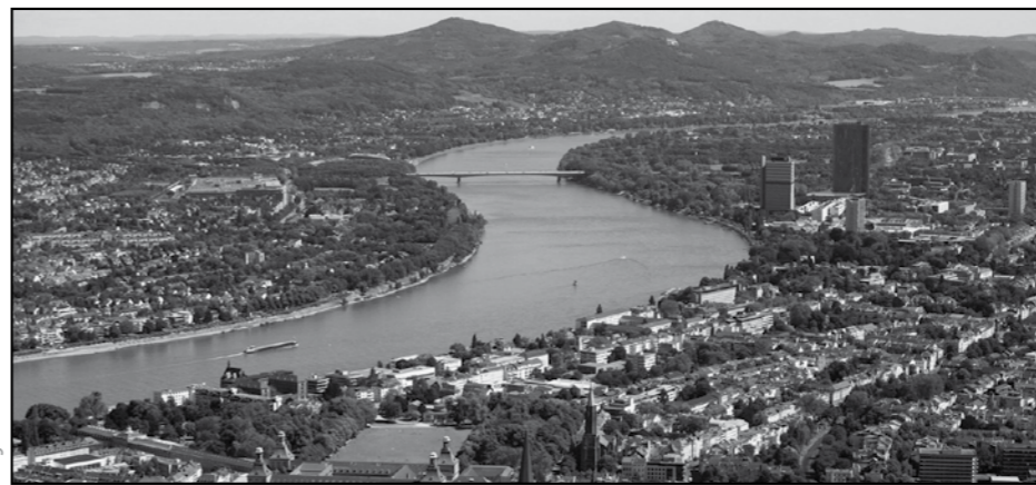
Fluß Rhein, Rhein-Main Gebiet.

Sein Blick flackert über den Rhein, aber er hört das Plätschern der Wolga, des Obs und der Kolyma. Bereits in der Wiege hatte er angezogen