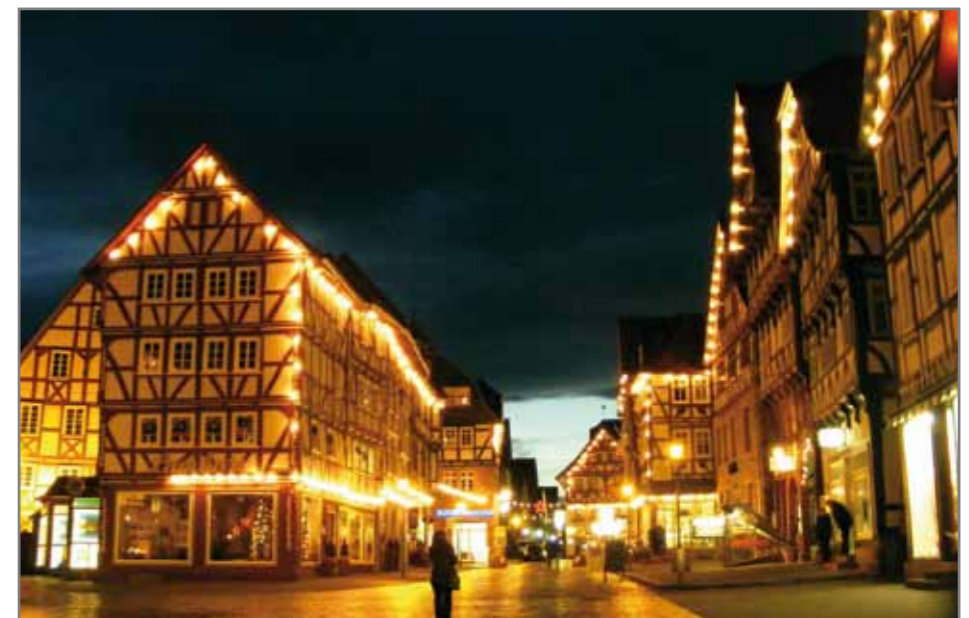
Рождественский Marktplatz в г. Fritzlar