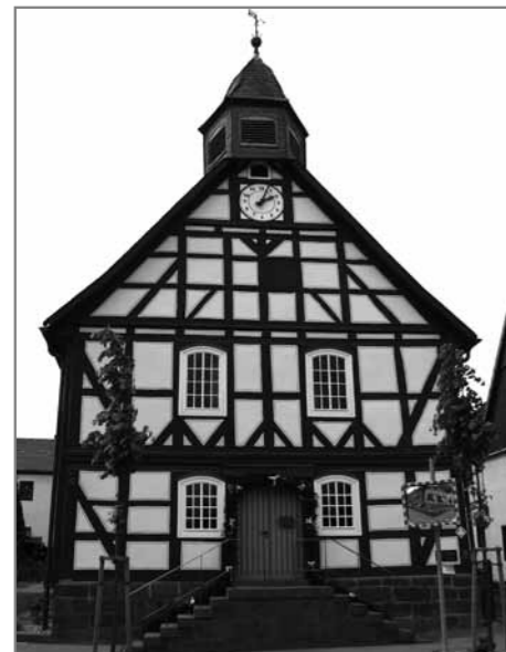
Гугенотская церковь в селе Schöneberg (Hofgeismar)

➤ – Fächerrossette. Воспроизводят они классическую форму раковины, служат также символом солнца. Богатые фахверки украшены башенками, эркерами, профильными карнизами, пилястрами, фигурными консолями и угловыми стойками, резными орнаментами и рельефами. Особенно распространена была резьба в 17-18 веках, прежде всего в нижнесаксонском фахверке. Образчик подобной постройки, так называемую Junkerschänke, мы сняли в Гёттингене. Это старейший ресторан Германии. Возведен он в 15 веке, сегодняшний вид приобрел в 1547-48 гг. При реставрации в 1983 году особое внимание было уделено украшениям резным: библейские сцены, знаки зодиака, портреты, орнаменты. Масляная краска не только придает зданию многоцветье, но и предохраняет предметы трудоемкой глухой