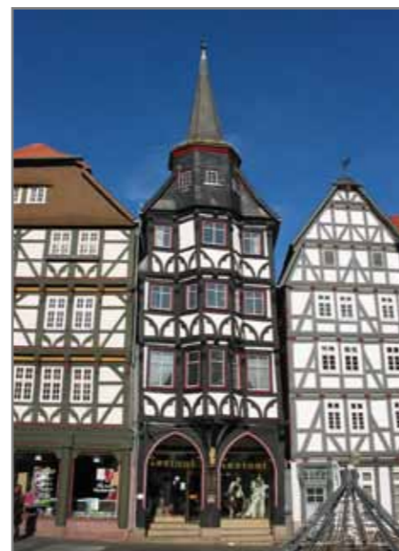
Гостиница в г. Fritzlar