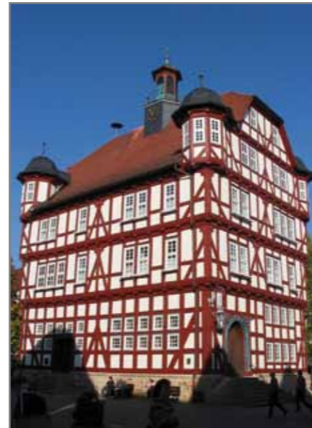
Ратуша в г. Melsungen'e