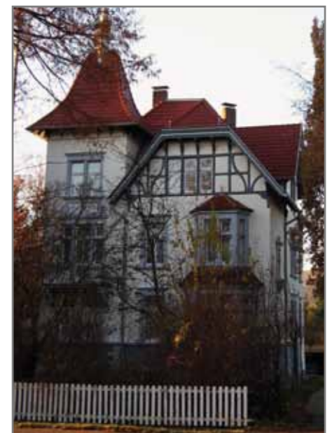
Элементы фахверка в каменном особняке