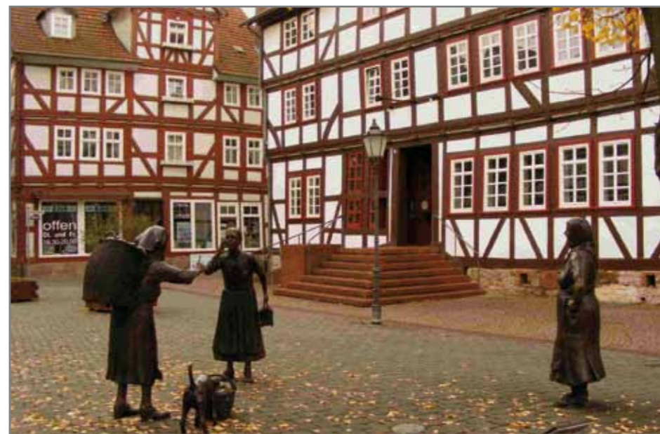
Marktplatz в г. Fulda