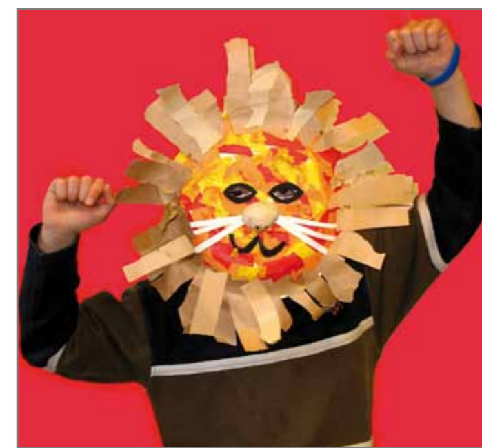
Илл. 5 - Ник (8 лет) в маске льва