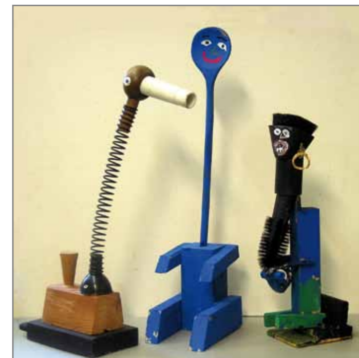
Илл. 4 - Ник (8 лет) «Утка», «Любопытный» и «Пират»