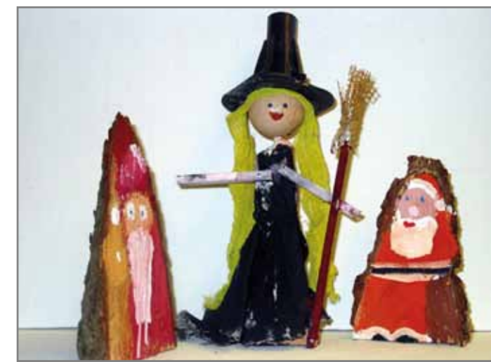
Илл. 2 - Кати (8 лет) «Ведьма с метлой»