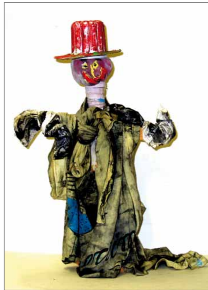
Илл. 3 - Лириан (7 лет) «Огородное пугало»