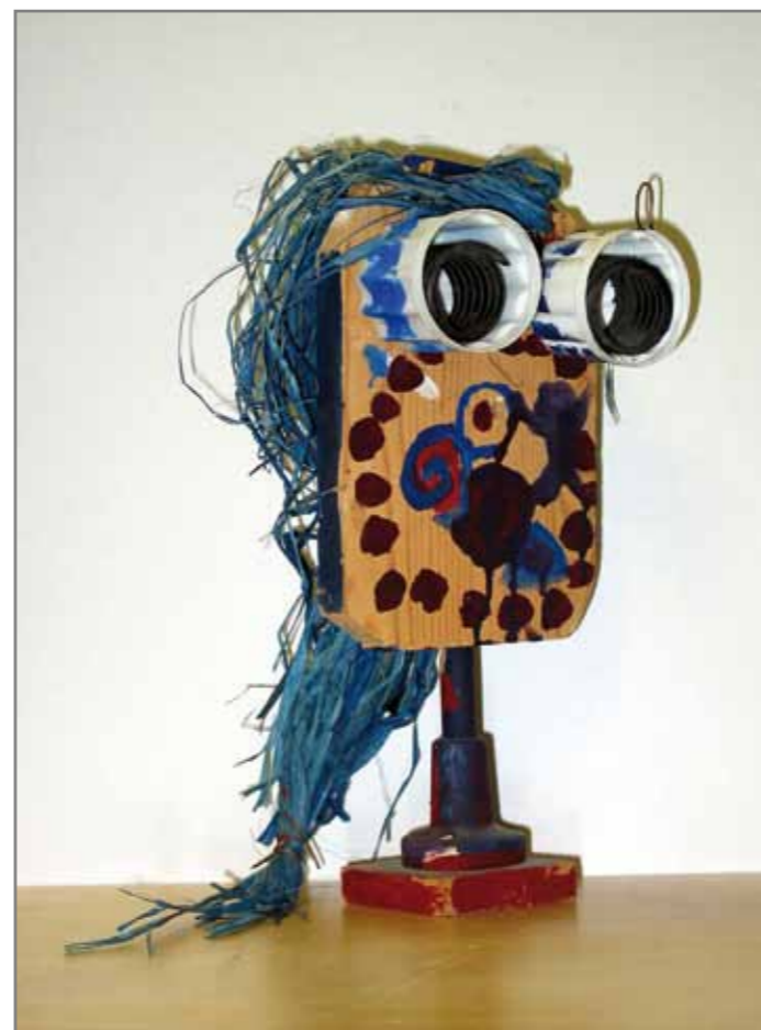
Илл. 1 - Симон (9 лет) «Головоног»