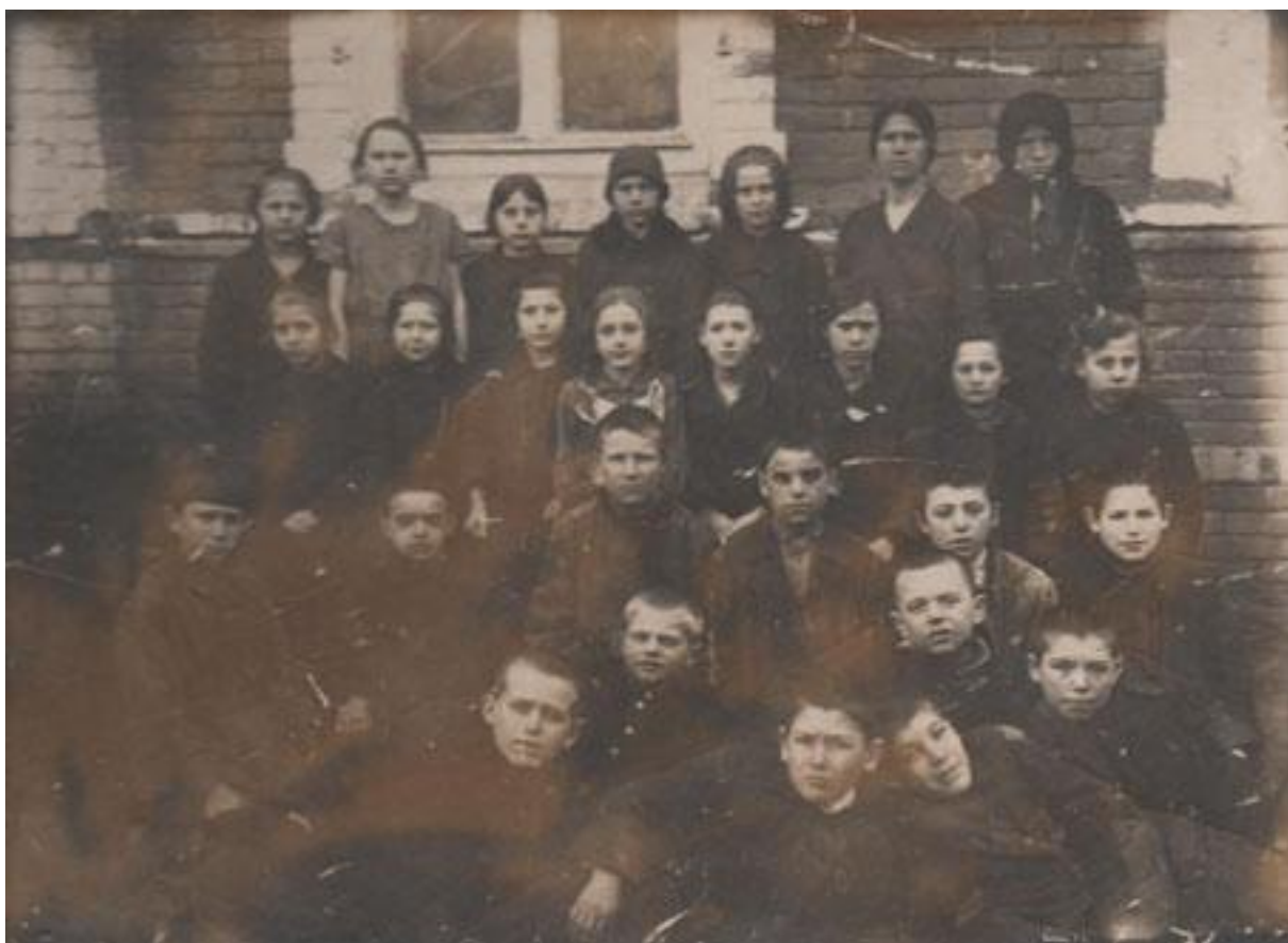
Группа учеников перед школой в селе Нидермонжу. Фото 1930-х годов.