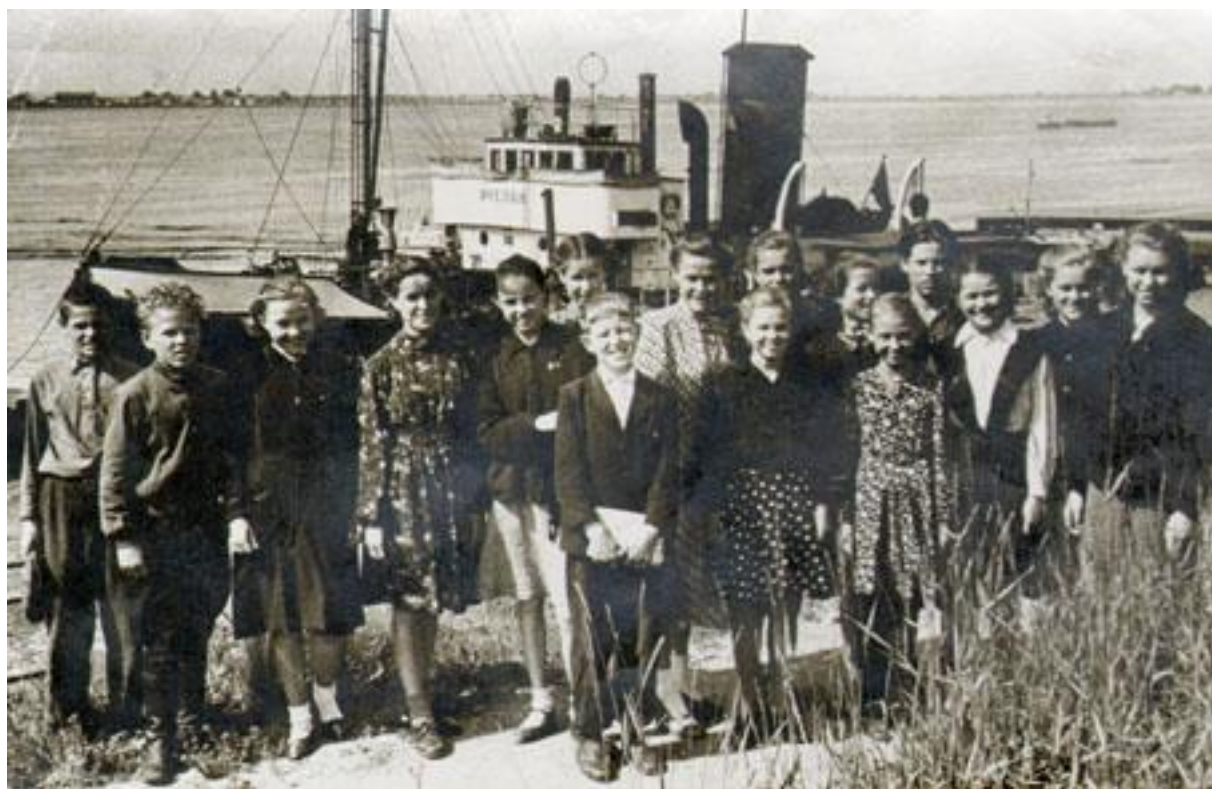
г. Архангельск, 1951 год. Группа школьников во время экскурсии. Моя мама – 5-я справа.