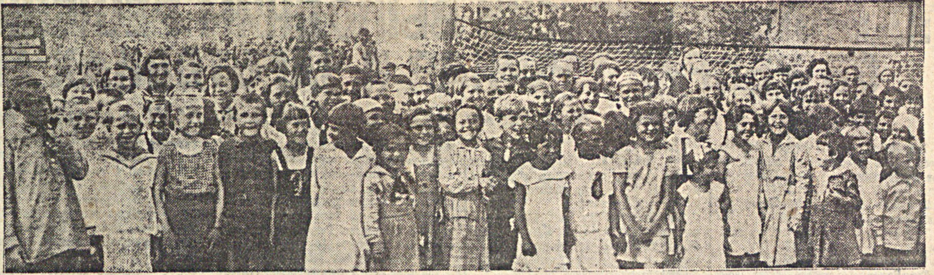
Учащиеся Энгельской школы № 19 на празднике по окончании учебного года.

Помощник государственного секретаря по защите детства—Сюзанна Лажор.