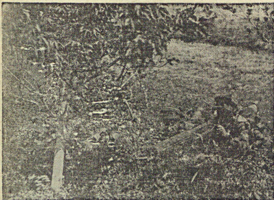
Летная учеба в РККА. На снимке: На занятиях со станковым пулеметом. (часть т. Котельникова, лагерь им. Ворошилова).