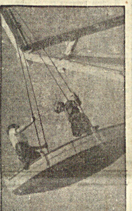
В связи с окончанием учебного года в г. Куйбышеве состоялся школьный праздник. На снимке: ученики 15-й школы, 7-го класса Реинкова Нюся и Тихонова Наталья катаются на качелях в Центральном парке культуры и отдыха на школьном празднике.