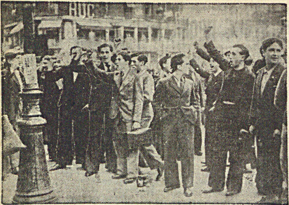
Столновение между фашистами и антифашистами в Париже

У вокзала Сент-Лазар в Париже произошло столкновение между членами распушенных фашистских лиг и приверженцами народного фронта. На снимке: группа участников народного фронта поет «Интернационал»