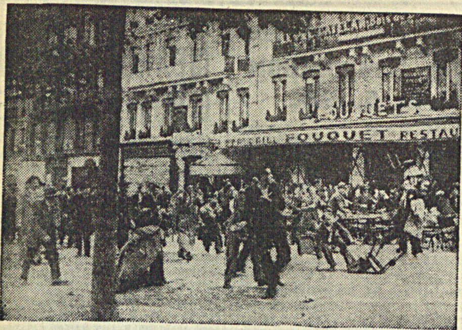
Фашисты громят парижские кафе

В Париже произошло столкновение между членами распущенных фашистских организаций и сторонниками народного фронта, во время которого фашисты разгромили кафе.