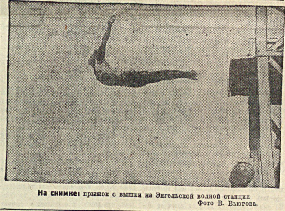
На снимке: прыжок с вышки на Энгельской водной станции