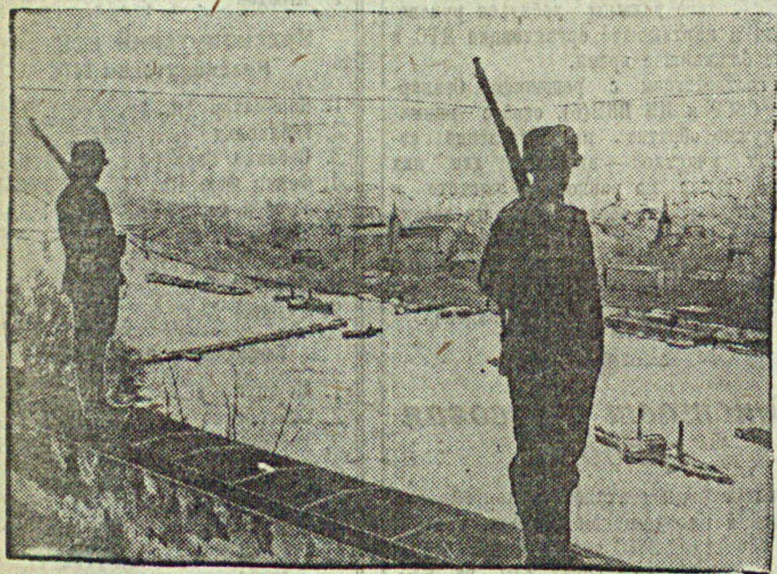
Опасность войны нависла над Рейном. Оккупация фашистской Германией Рейнской области привлекла вплотную к французской границе германские пушки и штыки. Миллионы трудящихся Франции почувствовали дыхание грядущей войны. На снимке: германские часовые на границе у Рейна.

«Бритиш юнайтед пресс» передает из Гибралтара, что, по полученным здесь сообщениям, адмирал германского броненосца «Дейчланд» вчера посетил фашистского генерала Франко в Сеуте. Радиостанция в Сеуте оповестила, что офицеры и экипаж «Дейчланд» высказались в Сеуте и что германский адмирал был принят генералом Франко. Трансляция закончилась исполнением германского и итальянского национальных гимнов.