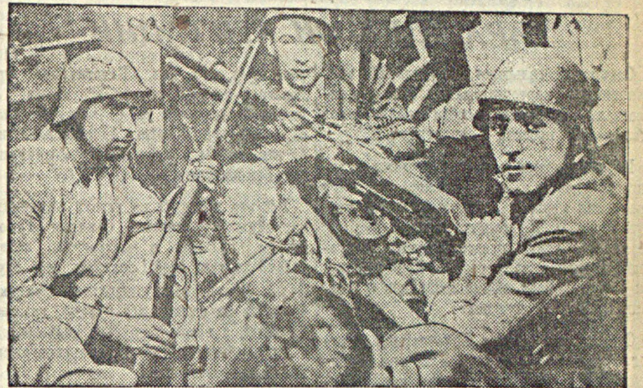
И военно-фашистскому мятежу в Испании Организованная рабочая милиция показывает чудеса храбрости и энтузиазма в боях с фашистскими мятежниками. На снимке: отряд рабочей милиции у пулемета.