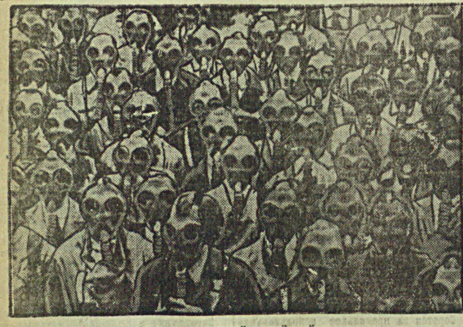
Перед угрозой новой войны. В будущей войне не будет ни тыла, ни фронта. Военщина буржуазных стран, готовящая новую войну, пытается привлечь гражданское население и участие в военно-воздушных маневрах. На снимке: служащие лондонской фабрики на военной противозвуковой тренировке. (из «Нью-Йорк Таймс»).