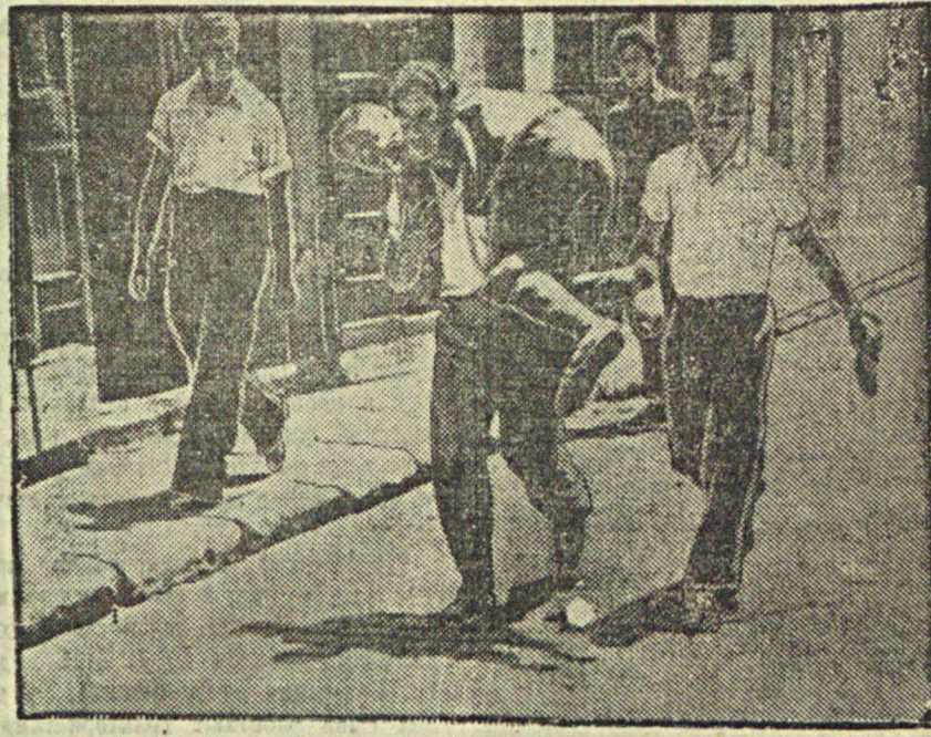
В недавнем бою в Барселоне. На снимке: рабочие Барселоны переносят раненого в уличном бою товарища.