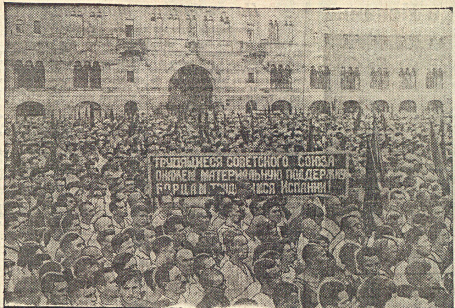
8 августа в Москве на Красной площади состоялся грандиозный митинг солидарности трудящихся Советского Союза с героическим испанским народом, борющимся с мятежными фашистскими генералами и с оружием в руках отстаивающим свободу и независимость своей страны. На снимке: общий вид митинга.