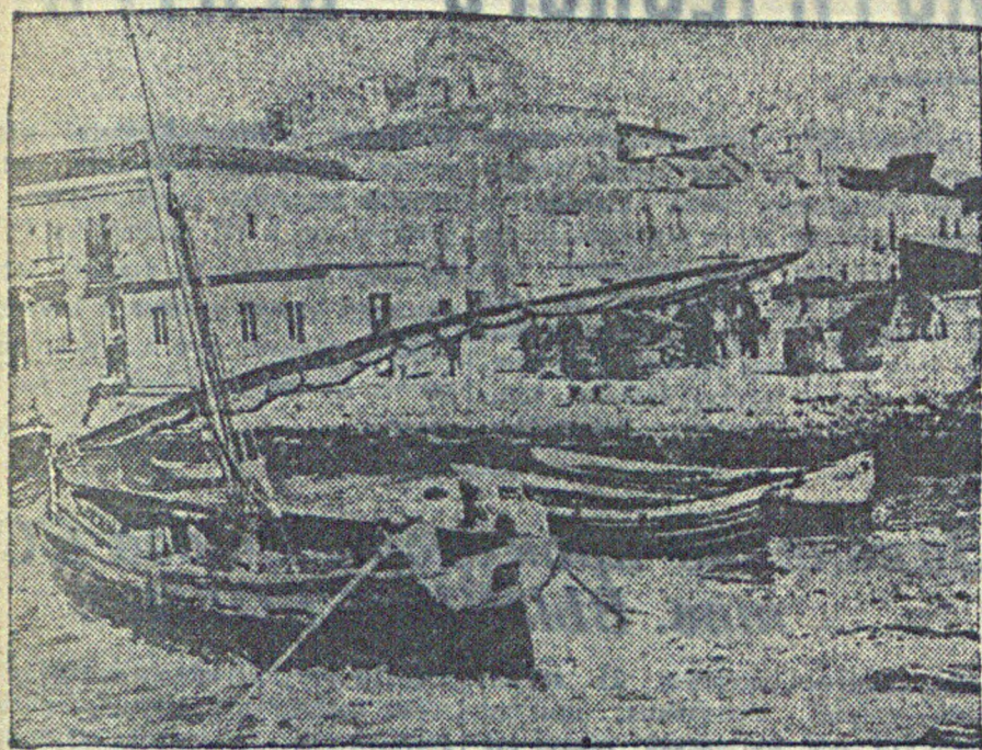
На снимке: вид гавани Алжесира (на южно-испанском побережье), где фашистские мятежники высадили десант. Местные рабочие оказали им упорное сопротивление.