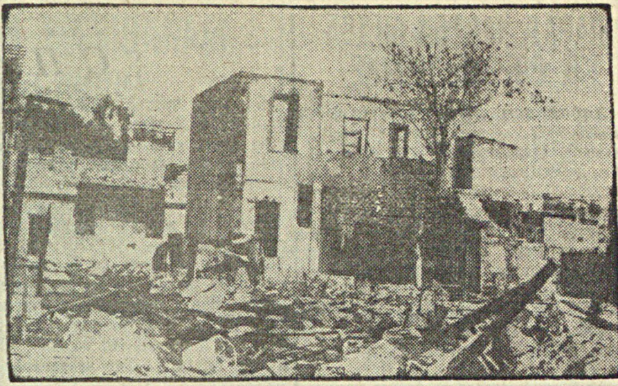
Волнения в Палестине. На снимке: развалины подожженного арабами здания на окраине Тель-Авива. (Союзфот).

ВЕНА, 23. По сообщениям из Берна, правительство Швейцарии обратилось к населению с воззванием о подписке на военный заем в 235 миллионов франков, поскольку в связи с положением в Европе независимость и нейтралитет Швейцарии находится под еще большей угрозой, чем в 1914 году».