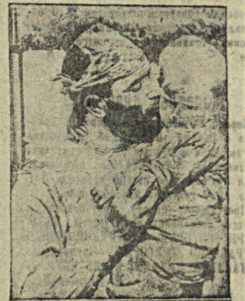
К событиям в Испании. На снимке: Арагонский крестьянин боем народной милиции прощается со своим ребенком перед отправкой на фронт.

Лондон, 6. Английский консул в Горе (юго-западная Абиссиния), покидающий Абиссинию, сообщил, что вместе с ним в Гомбелу (близ границы Судана) выехал рас Имру, возглавлявший абиссинское правительство в Горе. По словам «Рейтера», отъезд раса Имру из Горе, по видимому, свидетельствует об окончании организованного сопротивления абиссинцев итальянским войскам.