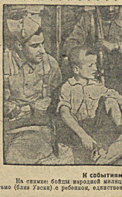
На снимке: бойцы народной милиции беседуют после взятия селения Спатома (близ Уэски) с ребенком, единственным оставшимся в живых из семьи в 9 чел.