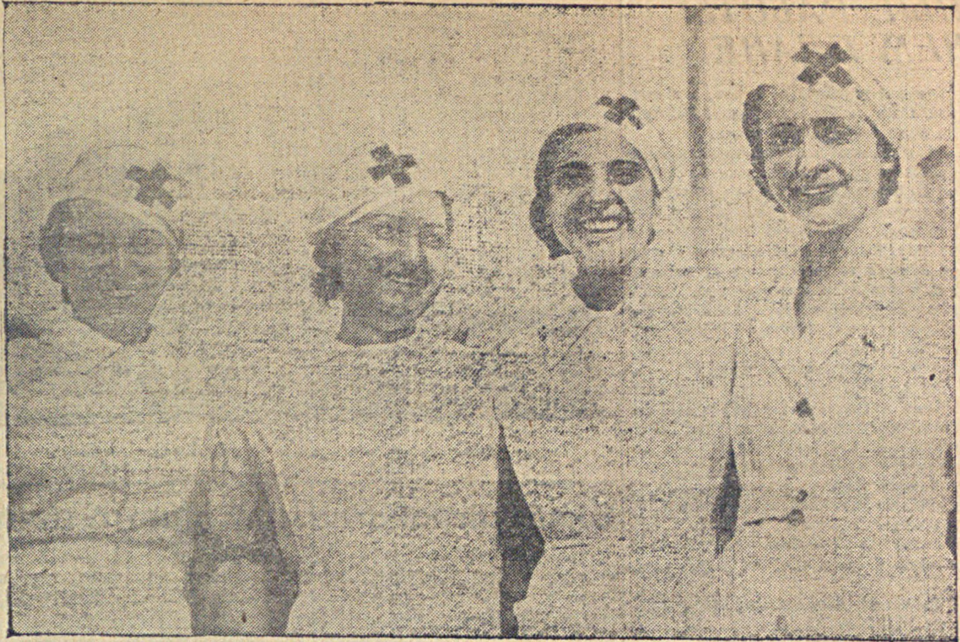
К событиям в Испании. На снимке: сестры пункта Красного креста правительственных войск на центральном фронте.

* Париж, 12. Вчера в Марселе портовые рабочие, работая бесплатно, погрузили на испанский пароход, направляющийся в Алжир, 800 тонн груза, в том числе два санитарных автомобиля. * Лондон, 13. Вчера в Палестине закончилась забастовка арабов, продолжавшаяся свыше 4-х месяцев. В стране возобновилась нормальная деловая жизнь. Во всех городах и на всех дорогах снова военная охрана. Одновременно новому командованию предложено «быть на всякий случай готовым к чрезвычайным мерам». * Шанхай, 13. Харбинский корреспондент агентства Ухалей сообщает, что отряд повстанцев, насчитывающий свыше 100 человек, окружил отряд японских солдат. В бою убито более пятидесяти японских солдат и офицеров.