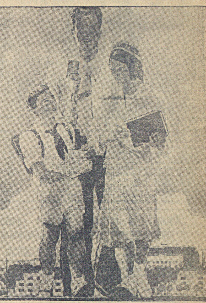
К XIX годовщине Великой Пролетарской революции Изогина выпускает серию художественных плакатов...