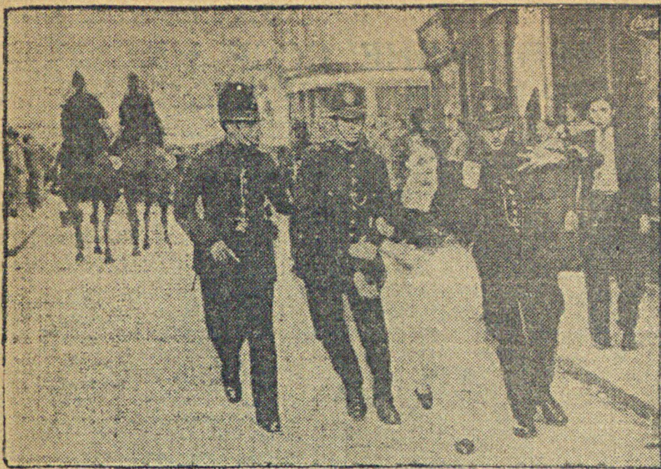
Сотни тысяч трудящихся Лондона дают отпор фашистам... Сотни тысяч трудящихся Лондона дают отпор фашистам. Восточная часть Лондона (так называемый Ист-Энд), населенная преимущественно трудящимися, была 4-го октября ареной грандиозного антифашистского выступления масс.