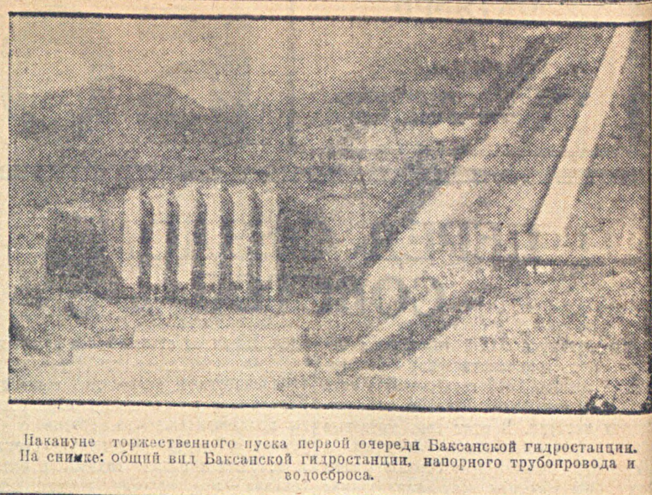
Накануне торжественного пуска первой очереди Бакинской гидроэлектростанции. На снимке: общий вид Бакинской гидроэлектростанции, напорного трубопровода и подбросов.

Кроме того, ЭКОСО РСФСР был рассмотрен вопрос о работе промисловской кооперации Дагеставской АССР и Карацевской автономной области.