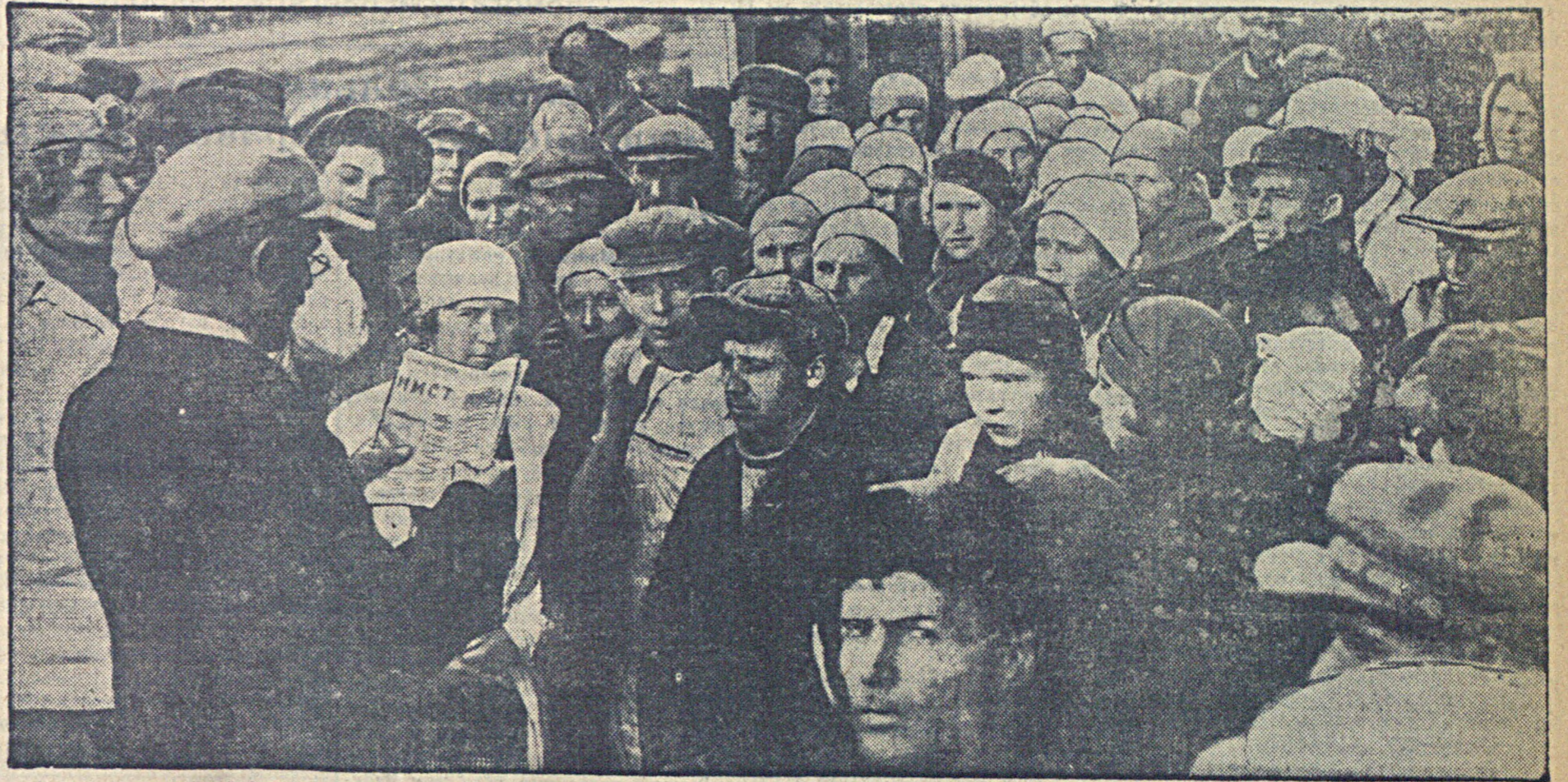
Вчера на Энгельской безбюджетной фабрике состоялся митинг по поводу заявления тов. Майского в комитете по вопросам невмешательства в дела Испании. На снимке: момент чтения заявления тов. Майского.

Справедливость позиции советского правительства, решительно разоблачившего комедию невмешательства, позиции, единодушно поддерживаемой советским народом, будет признана всем миром. Дело остальных государств сделать из этого должные выводы. (Из передовой «Правды», за 24 октября).