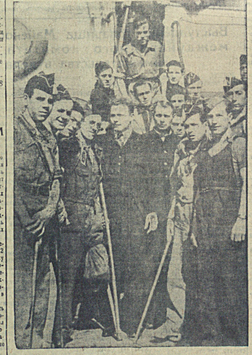
На снимке: раненые бойцы правительственных войск на борту «Зырянна»