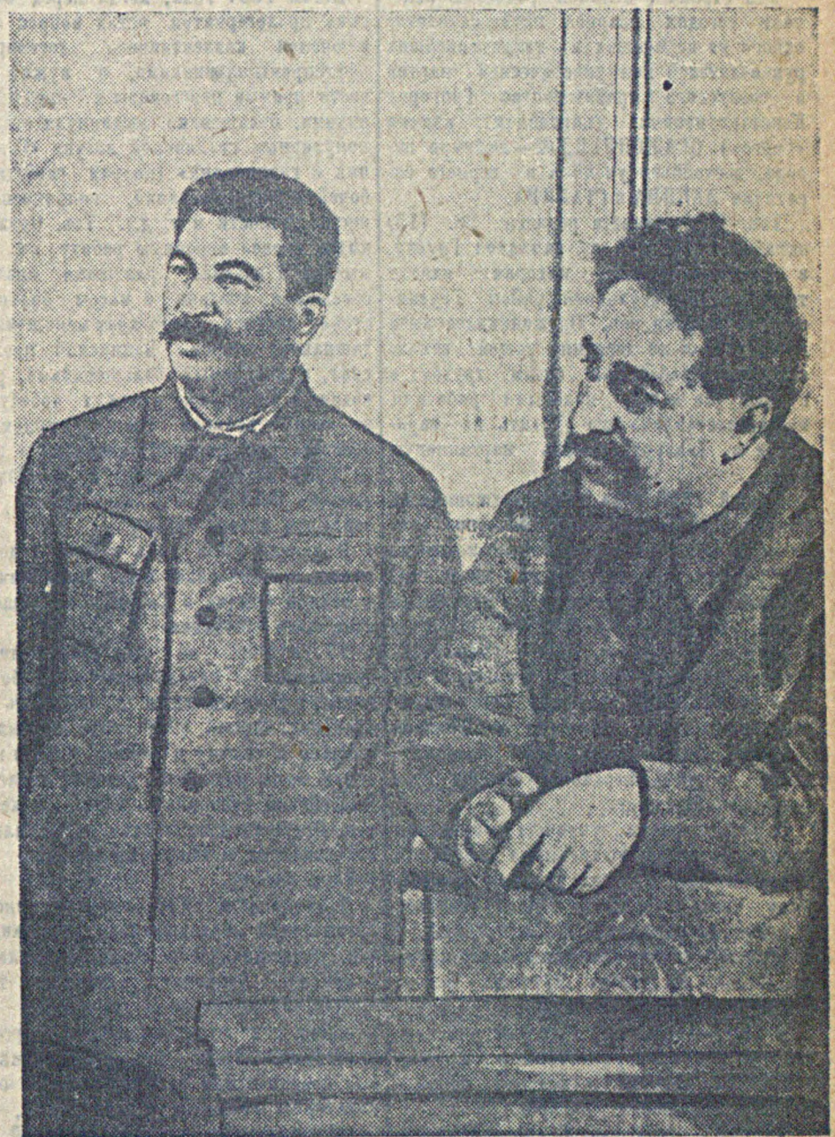
В 50-летие наркома тяжелой промышленности СССР тов. Г. И. Орджоникидзе на снимке: товарищи Сталин и Орджоникидзе в Кремле на приеме делегации трудящихся Грузинской ССР (19 марта 1936 года)