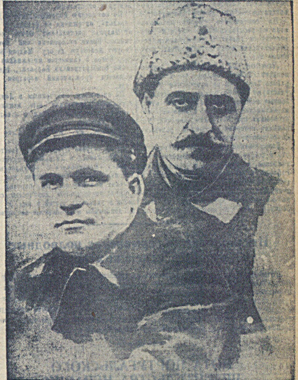
Т.г. Орджоникидзе и Киров во время гражданской войны.