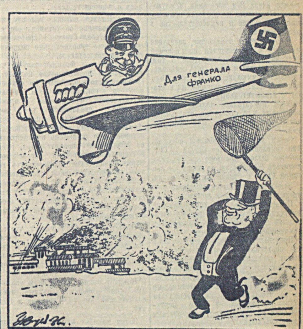
Лорд Плимут готов применить «самые суровые меры борьбы» с вмешательством в испанские дела