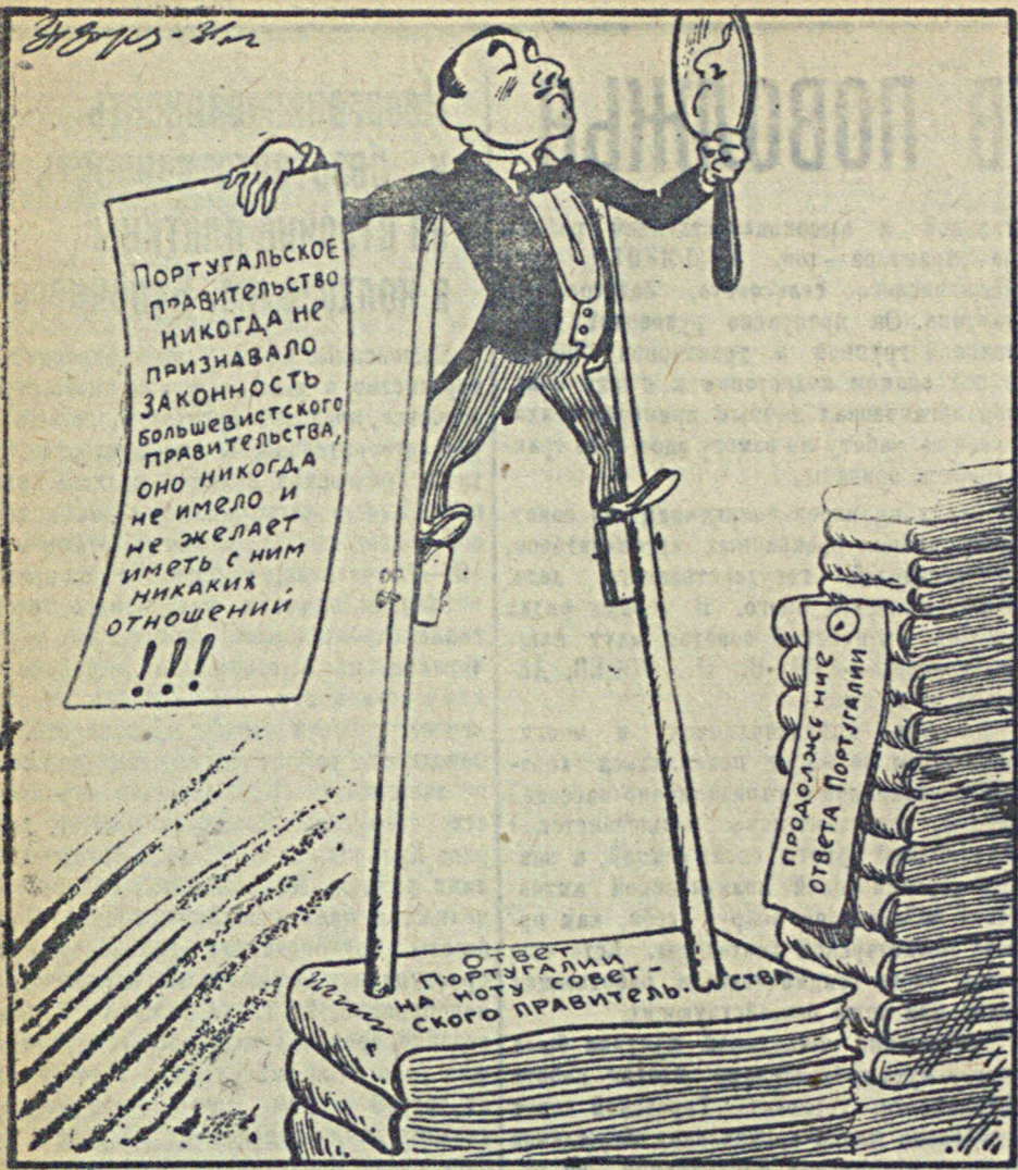
В упоении собственным величием