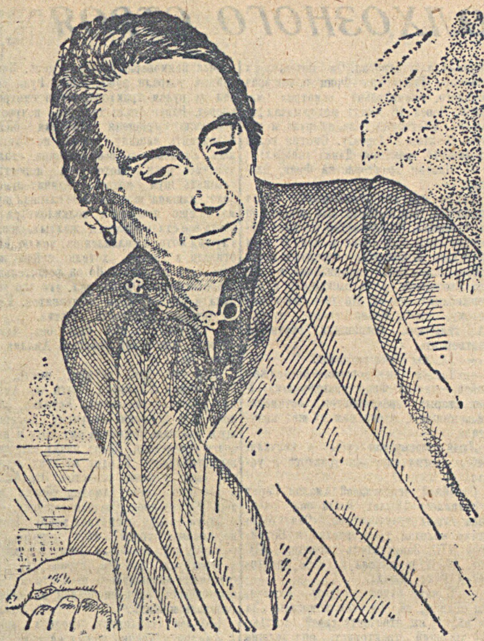
Долорес Ибаррури (Пасионария)