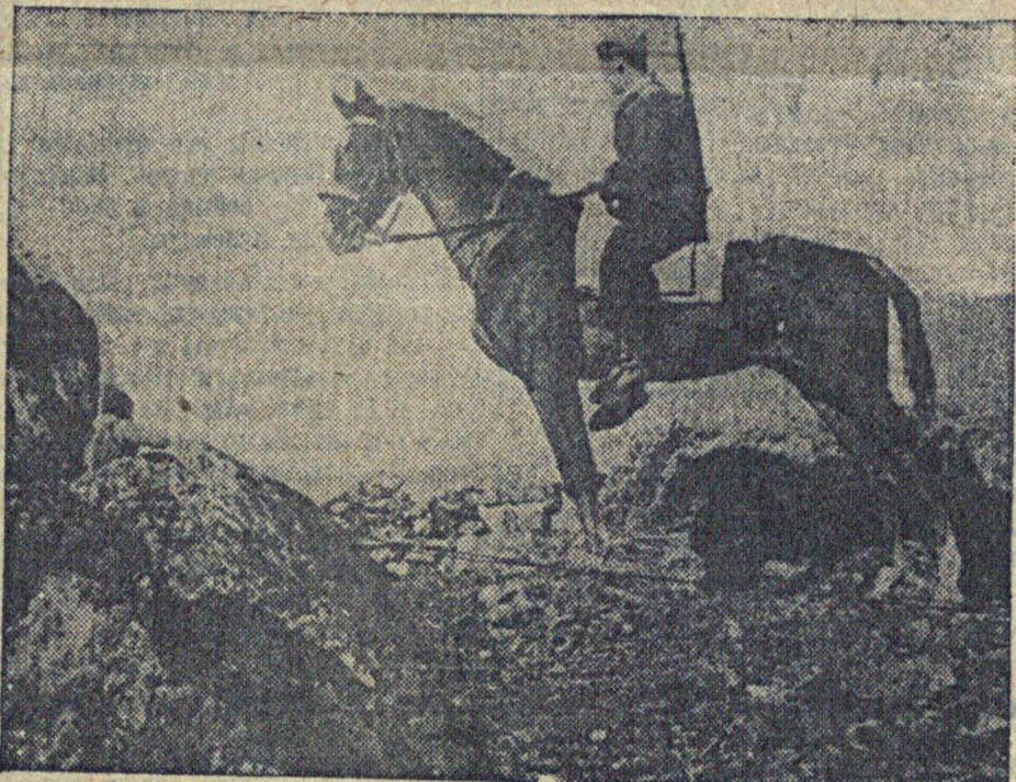
И событиями в Испании. На снимке: конный дозор правительственной армии на центральном фронте.