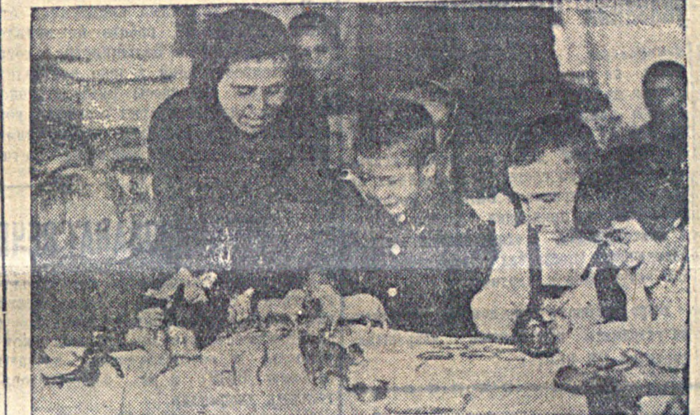
В детских яслях совхоза строителей гор. Энгельса.

Половое качество ухода за тракторами, ремонт только той части, которая выбыла из строя, без осмотра всего трактора — приводит к выходу из строя тракторов то по одной, то по другой причине.