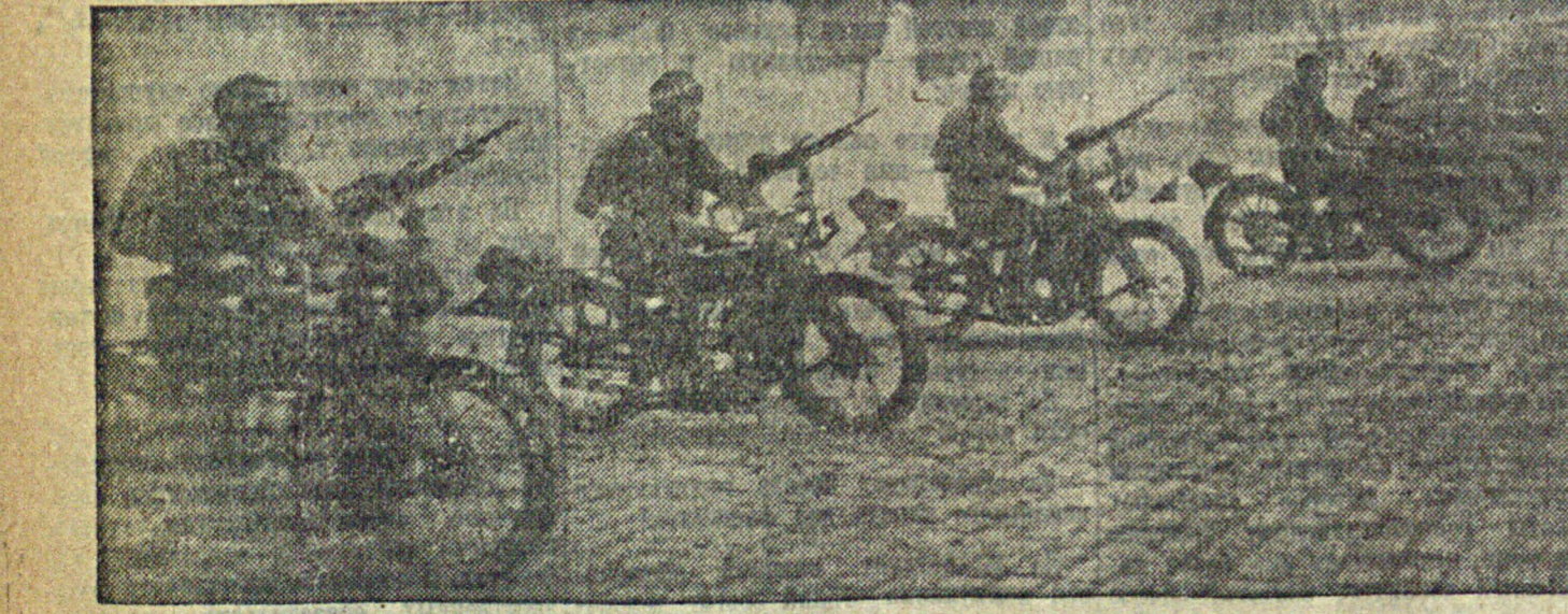
Празднование в Москве 11-х годовщины Великой пролетарской революции. Парад на Красной площади. На сцене молодильники-пулеметчик на параде.