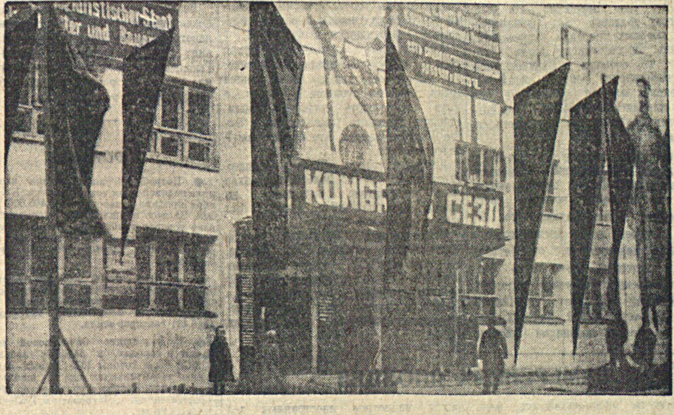
На снимке: Государственный Академический немецкий театр, где работает X съезд Советов АССР немцев Поволжья.