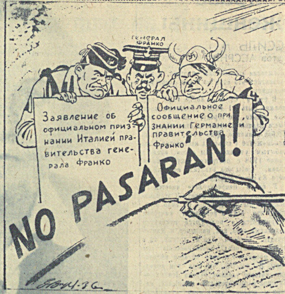
Краткий ответ испанского народа на ноты фашистских интервентов: «Они не пройдут!»