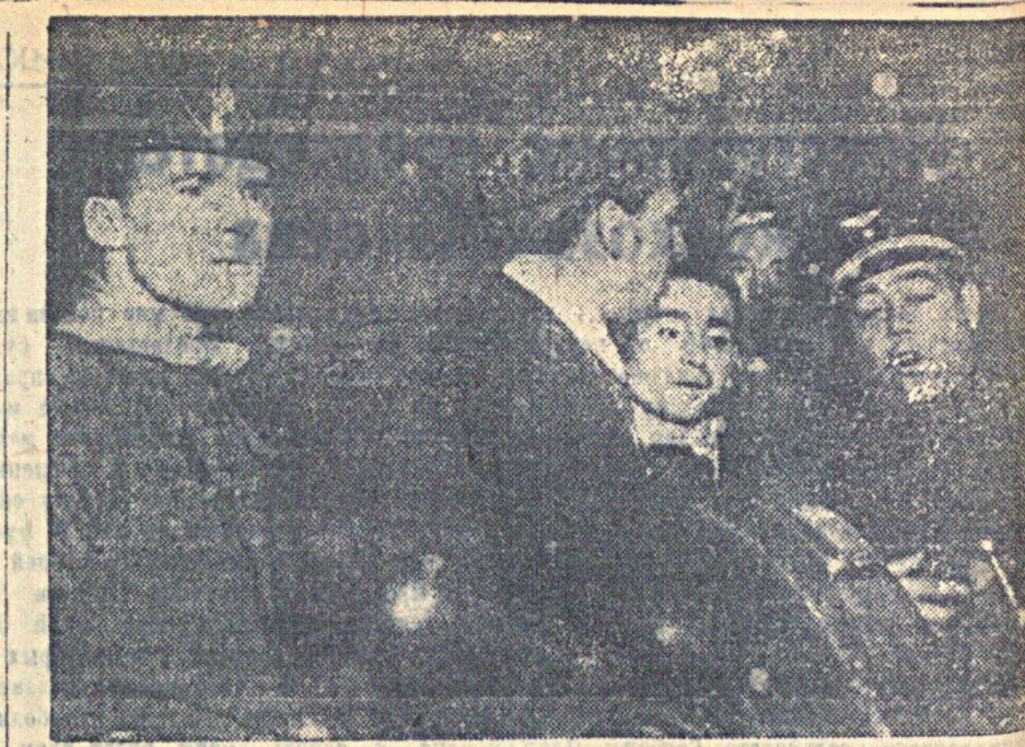
11 ноября вторая испанская делегация посетила Ленинградский металлургический завод им. Сталина, ф-ку «Скоростр» и Кировский завод. На снимке: испанские гости в 1-м механическом цехе Кировского завода.

В Непреспублике значительно расширяется сеть детских яслей и увеличивается число новых родильных домов.