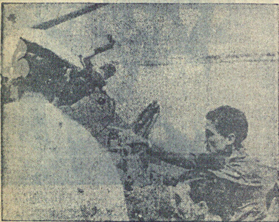
На снимке: учебная стрельба на военном корабле испанского правительственного флота в Средиземном море близ Барселоны.