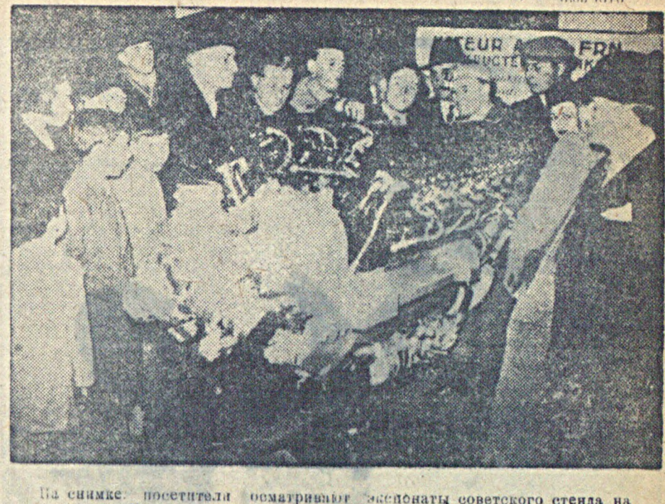
На снимке: посетители осматривают экспонат советского стенда на Международной авиационной выставке в Париже.