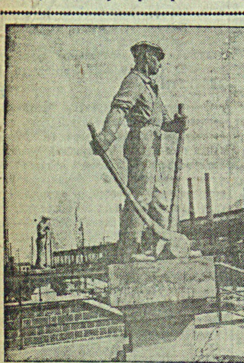
На территории завода «Красный Октябрь» (Сталинград) установлена статуя — фигура сталевара и вальцовщика. На снимке: уголок территории завода. На переднем плане фигура вальцовщика.

Доклад вождя вдохновил колхозников нашего кантона на борьбу за новые успехи в области хозяйственной и культурной жизни, разветвляется с еще большей силой социалистическое соревнование и стахановское движение.