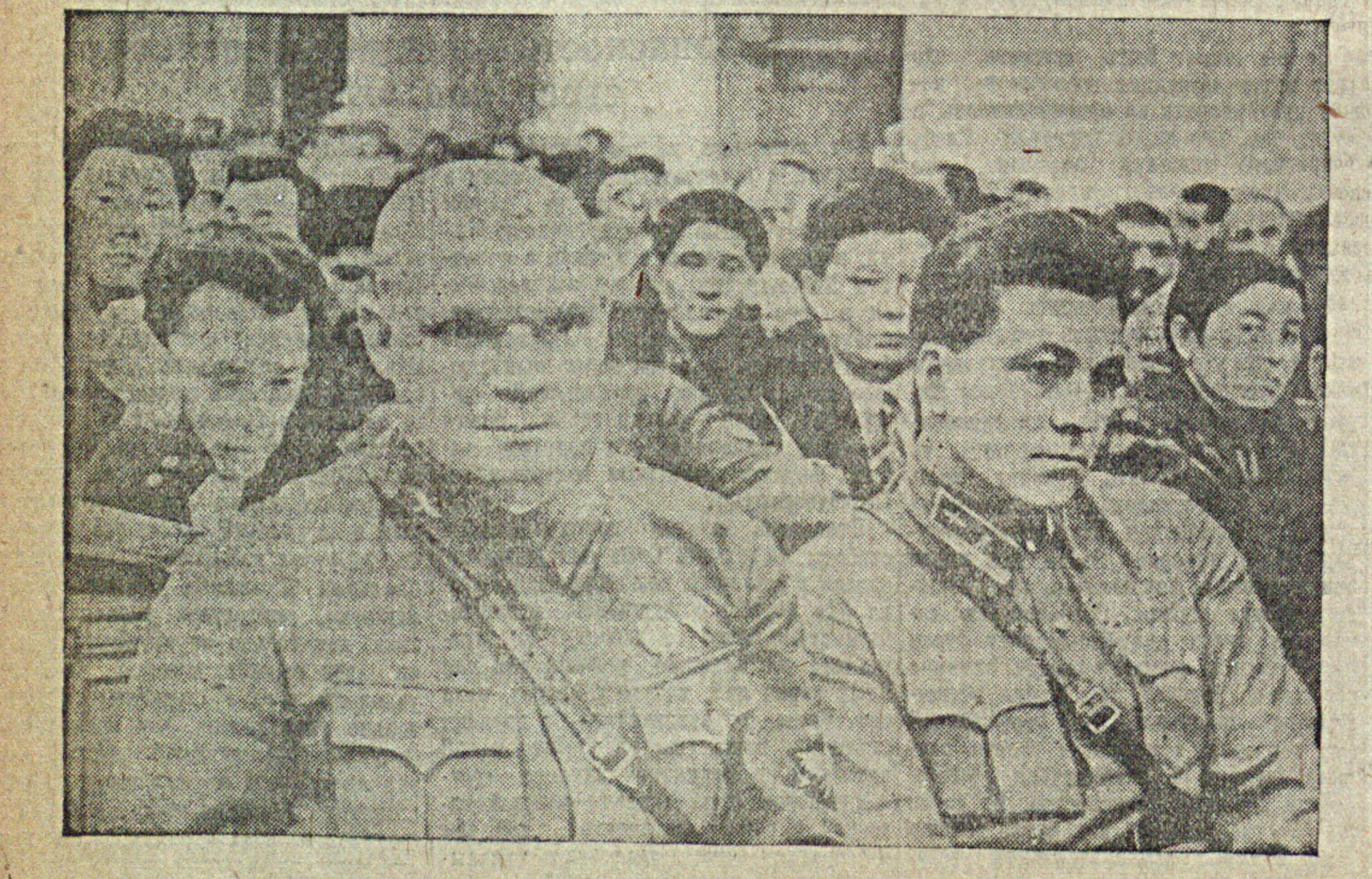
Чрезвычайный VIII Всесоюзный Съезд Советов. На снимке: в зале заседания—Герои Советского Союза (слева направо) гг. ДОРОНИН и ЛИПДЕВСКИЙ.

Советский народ готов бороться с фашизмом всеми доступными ему средствами, а фашистские государства, в свою очередь, будут бороться с нами всеми доступными им средствами.