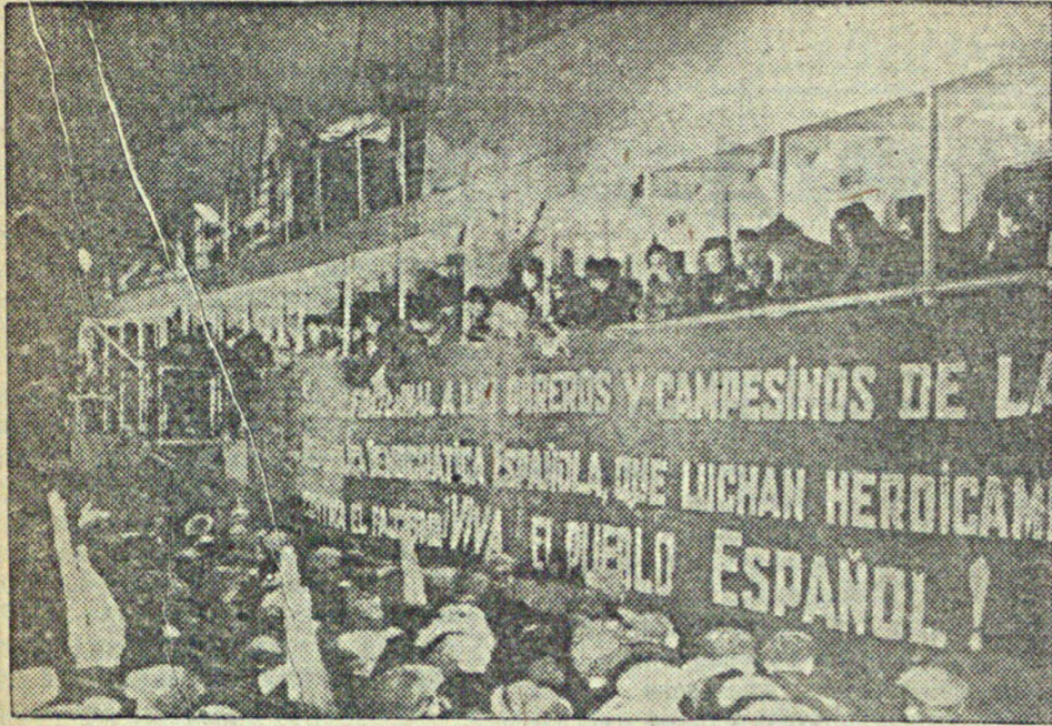
28 ноября трудящиеся Ленинграда сердечно провожали делегацию испанского народа, возвращающуюся на родину после пребывания в СССР. На снимке: митинг трудящихся Ленинграда на морском вокзале перед отплытием теплохода «Сибирь» с испанскими делегатами.