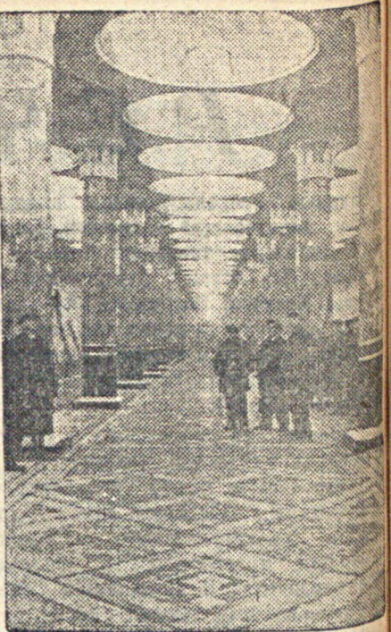
Строители второй очереди Арбатского радиуса московского метрополитена выполняли данные ими обязанности — досрочно сдать в дни заседания Чрезвычайного VIII Всесоюзного Съезда Советов новую линию метро. 29-го ноября со станции «Смоленская площадь» до станции «Киевская вокзал» прошел первый пробный поезд, совершивший несколько рейсов. На снимке: общий вид станции «Киевский вокзал».

Шанхай, 3. Начавшаяся на днях забастовка китайских рабочих на японских текстильных фабриках в Циндао (провинция Шаньдун) переросла во всеобщую забастовку, которая была объявлена 1-го декабря. Бастует 27 тыс. рабочих на всех девяти японских фабриках в Циндао. Предприниматели ответили объявлением общего локута. В Циндао прибыло 9 японских военных кораблей. Высажены десант, который занял важнейшие стратегические пункты города и помещения японских фабрик.