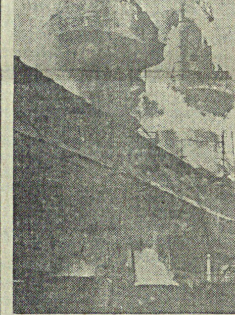
Доменный пех завода им. Петровского (Днепропетровск) поминает выплавку чугуна. Печь № 1 в октябре выполнила план на 117,7 проц., в ноябре задание выполняется на 114,3 проц., коэффициент использования печи 0,82.

Тов. Грушко заработал в ноябре 2050 рублей