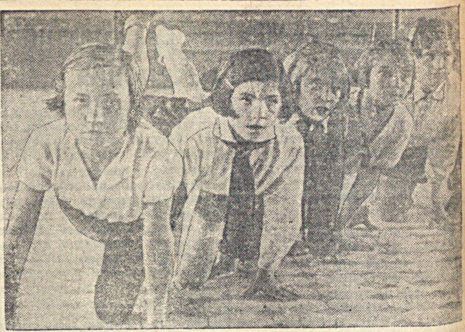
Ученики 6-го класса Энгельской школы № 1 на занятиях физкультуры.

Истинный и законный наследник великой, глубоко народной и общечеловеческой испанской культуры — испанский народ, героически сражающийся за свою свободу и независимость.