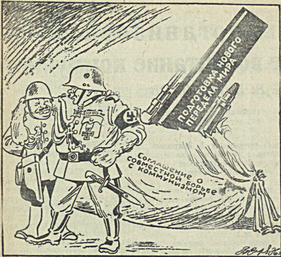
ШИЛО В МЕШКЕ.