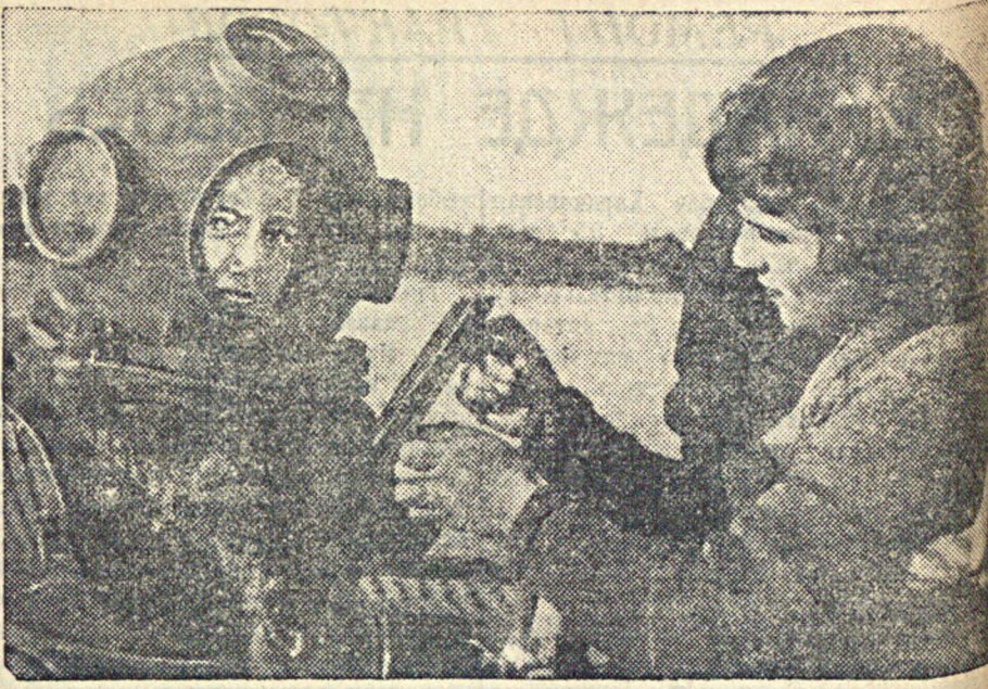
Около трех месяцев жевы водолазов и командиров Севастопольского отделения Эпрона изучают водолазное дело. В кружке подводного спорта — 11 женщин. Начальный курс теории в кружке уже пройден.

На этот вопрос, вызвавший вмешательство со стороны Спикера (председателя), ответа не последовало.