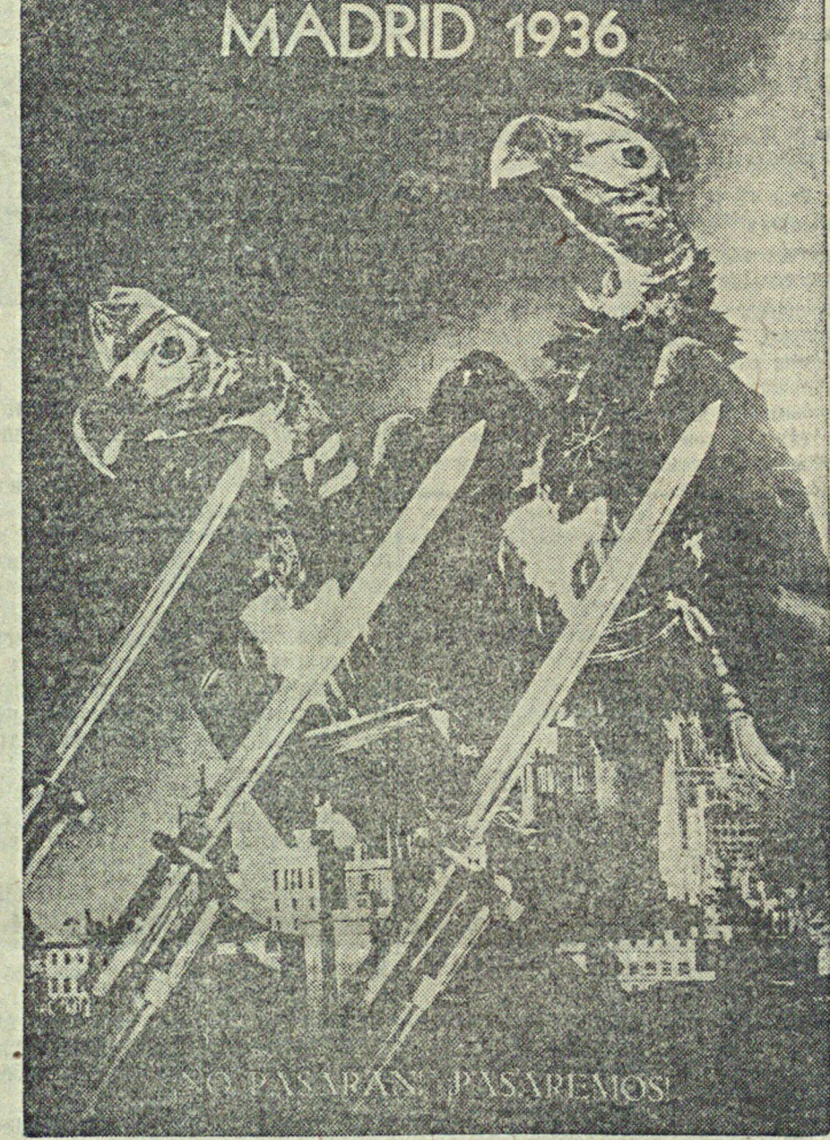
Мадрид в 1936 г. Фото монтаж Джона Хартфильда из журнала «Фолкс-Иллюстрирт» (Прага, от 25 ноября 1936 г.). Они не пролетят. Мы пролетим! Сокофто.

ЛОНДОН. 8. В Бильбао народный суд вынес приговор по делу группы мятежников, участвовавших в июльском восстании в казармах Лайолла в Сан-Себастьяне.