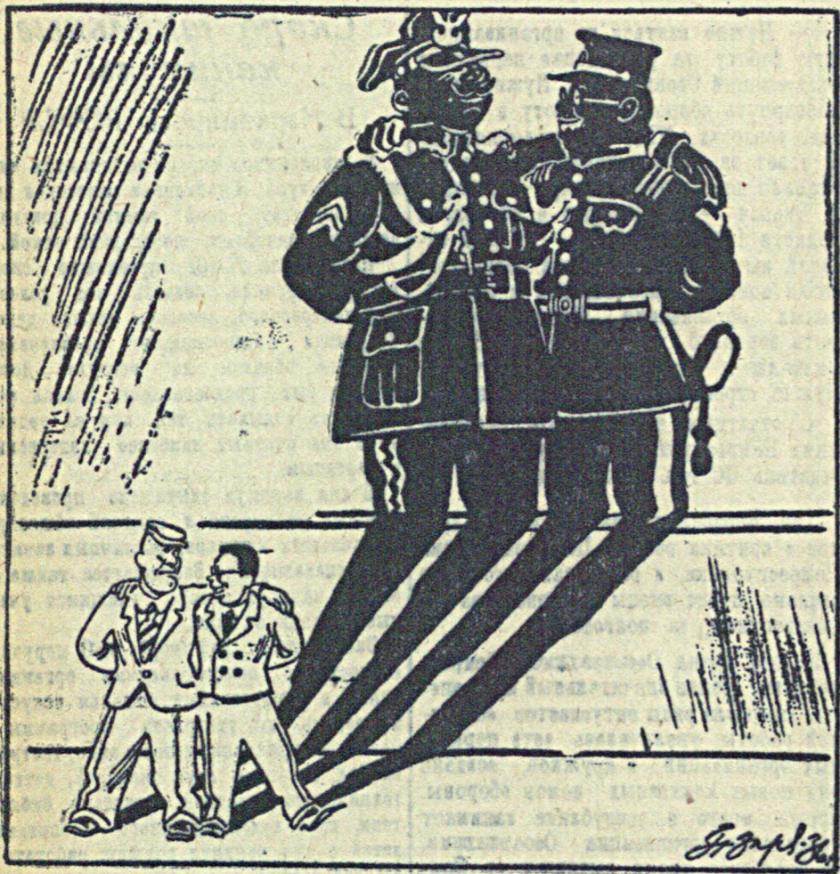
Студенты для ОБМАНА, или большеше тени маленьких фигур. Рис. П. Зора.

Японское правительство о своем намерении заключить с Польшей «культурное соглашение», по которому договаривающиеся стороны ежегодно будут обмениваться студентами.