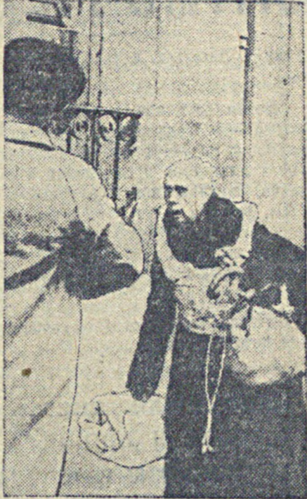
На снимке: старуха несет скарб — все, что удалось от ее дома, разрушенного бомбами фашистских авиации во время очередного налета на Мадрид.

Несколько самолетов мятежников, замеченные со стороны Торревехы (порт к югу от Аликанта) также обрелись в бегство при приближении республиканских самолетов.