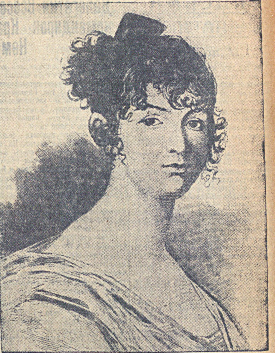
К 100-летней годовщине со дня смерти А. С. Пушкина (29 января ст. ст. 10 февраля н. ст. 1937 г.) На снимке: Н. О. Пушкина — мать поэта.

В Ерусланском совхозе обмен закончен уже несколько дней тому назад. У 23 зайкооперателей обнаружены выигранные в Красном Куте облигации предшествовала активная массовая работа. В селах было организовано 70 докладов о конверсии. Среди рабочих и служащих обмен в основном уже закончен. Выявлено большое количество выигранных.