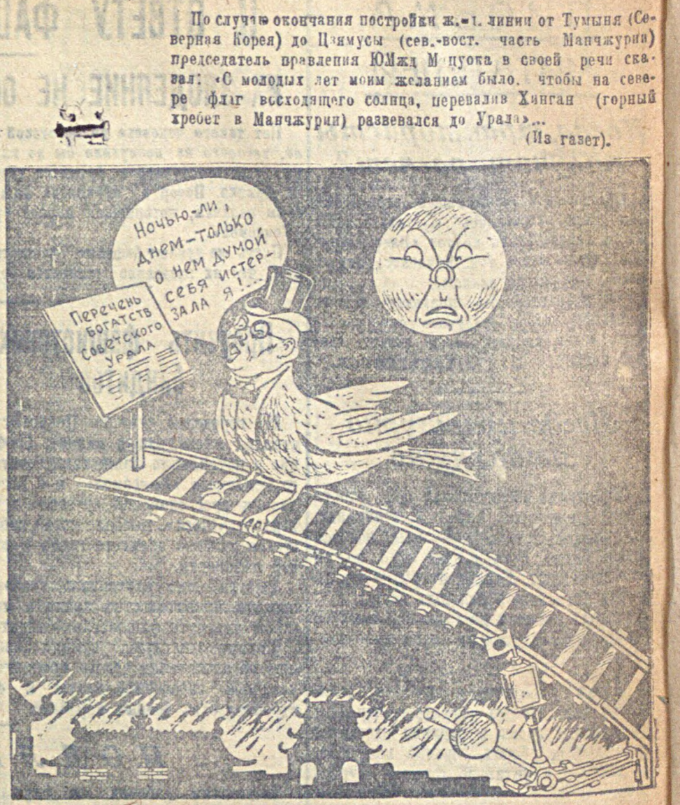
Антисоветский соловей на новой стратегической ветке ЮМЖД. Рис. П. Зора.

Завод построен недавно. В нем уста- новлены новые советские машины и оборудование. Молоды также и люди, ра- ботающие на нем. Большинство из них