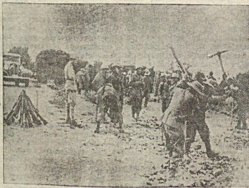
Бездорожье в занятой итальянцами северной части Абиссинии задерживает дальнейшее продвижение итальянских войск. Итальянские солдаты вынуждены заменять ружья кирками и превращать в дорожные строители. На снимке: итальянские солдаты прокладывают дорогу в северной Абиссинии. Слева — составленные винтовки.