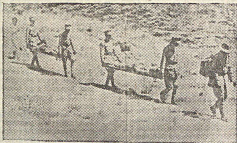
На снимке: транспорт раненых абиссинских солдат в госпиталь в Дессе