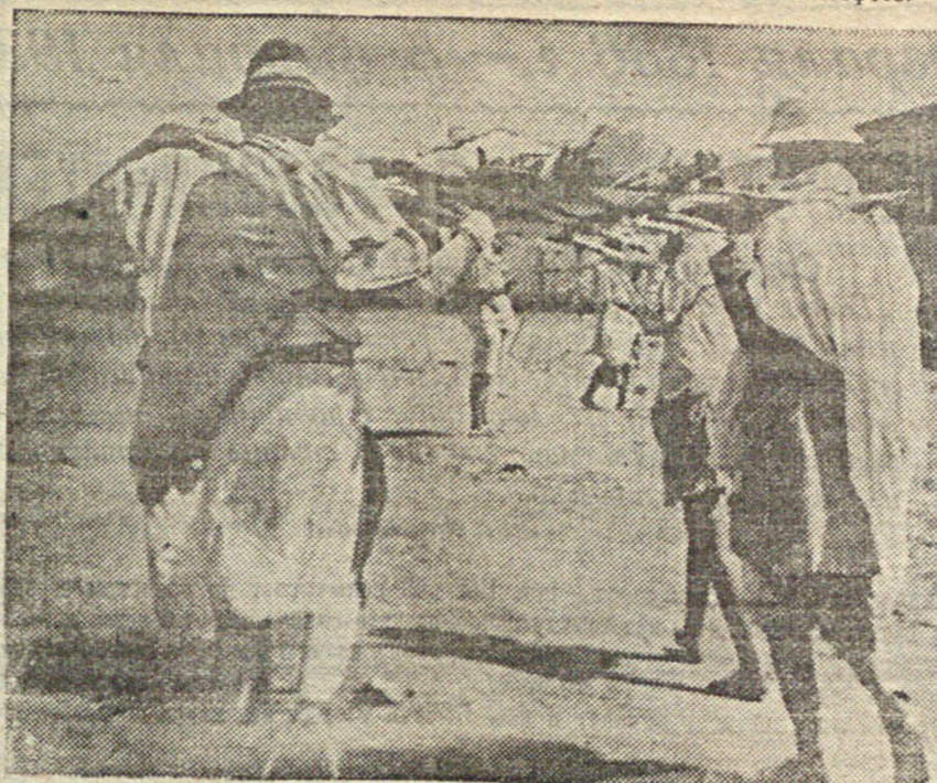
На снимке: похороны абиссинского солдата, убитого во время воздушной бомбардировки Дебубура итальянцами