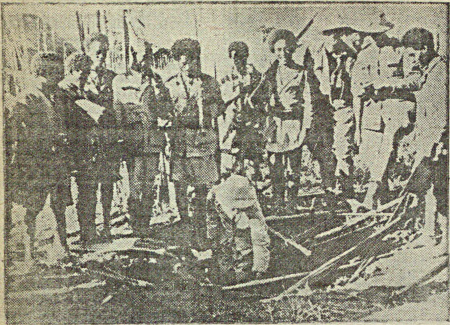
На снимке: абиссинские солдаты и сотрудники Красного креста после воз- душной бомбардировки Доло осматривают воронку, пробитую бомбой.