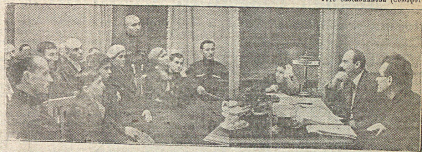
8 февраля зав. сельскохозяйственным отделом ЦК ВКП(б) тов. Я. А. ЯКОВЛЕВ принял прибывшую в Москву делегацию животноводов Северного Кавказа. На снимке: делегация животноводов на приеме у тов. ЯКОВЛЕВА.

Центральный Комитет партии указал на большую запущенность в партийной работе в Ростове и запретил начать обмен партийных билетов в двух райко-