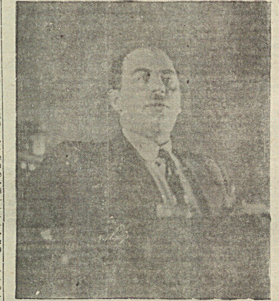
Показатели продуктивности животноводства в среднем по СССР и у передовиков в 1933 году.

НУЖНО В НАШЕМ 1936 ГОДУ ЛИКВИДИРОВАТЬ БЕСКОРОВОНОСТЬ ПО