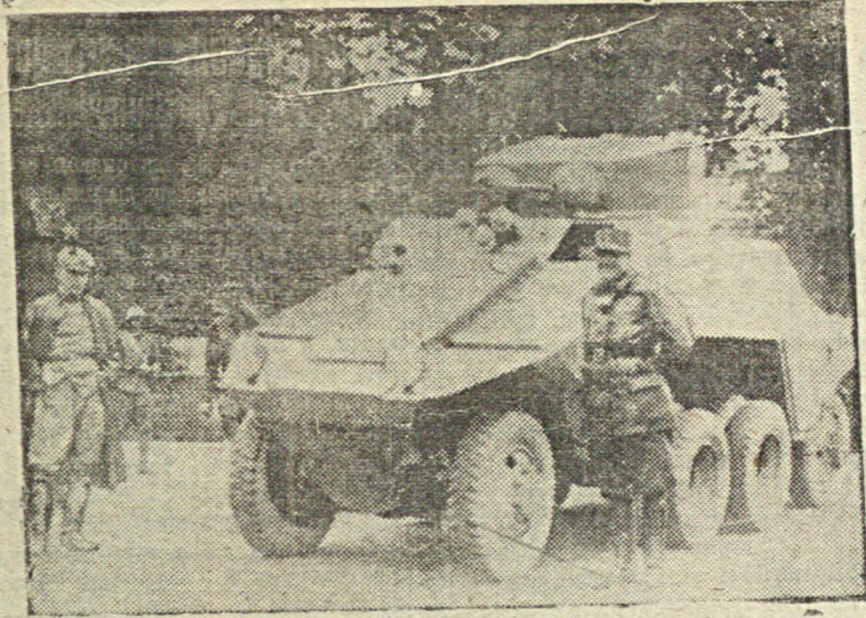
Моторизация австрийской армии. На снимке: новые броневики, введенные в австрийской армии.

Лондон, 24. В Аддис-Абебе опубликовано официальное донесение раса Имеру о рейде, проведенном абиссинскими войсками в итальянском тылу на северном фронте. Во время рейда убито 412 итальянских белых солдат. Двум лучшим отрядам, движущимся по направлению к реке Марек, было приказано атаковать итальянские пути сообщения между Адудей и Эритреей. Этими отрядами разрушено 15 складов амуниции, два депо, в которых находилось 30 танков и несколько грузовиков. Налет абиссинцев застал итальянцев врасплох, и после кратковременного сопротивления они бежали.