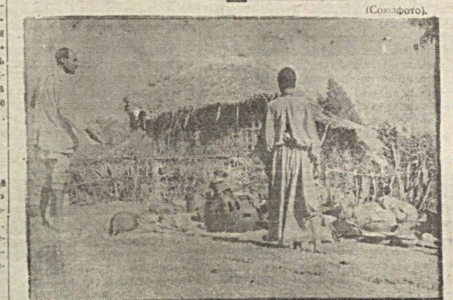
На снимке: горящее абиссинское селение в районе южного фронта после налета итальянских бомбардировщиков. На переднем плане спасенный жителями скарб.