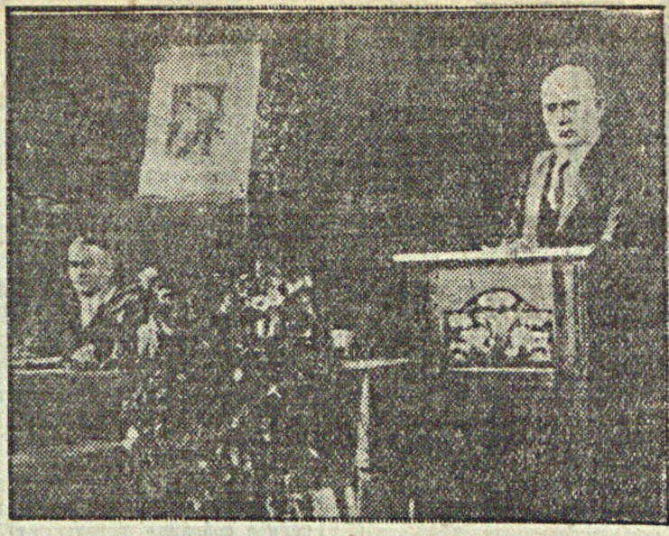
На снимке: тов. Тельман выступает на 10 съезде КПГ в Эссене (Германия) в 1927 году. Слева — в президиуме Вильгельм Пик.

Мы рады, — пишут учителя савинских и буринских школ Палласовского кантона, — сердечно благодарим партию, правительство и тов. СТАЛИНА за отеческое отношение к школе и учителю. Мы высоко поднимем звания коммунистического воспитания в школе, дадим видные грамотных учащихся, будем постоянно повышать свою квалификацию.