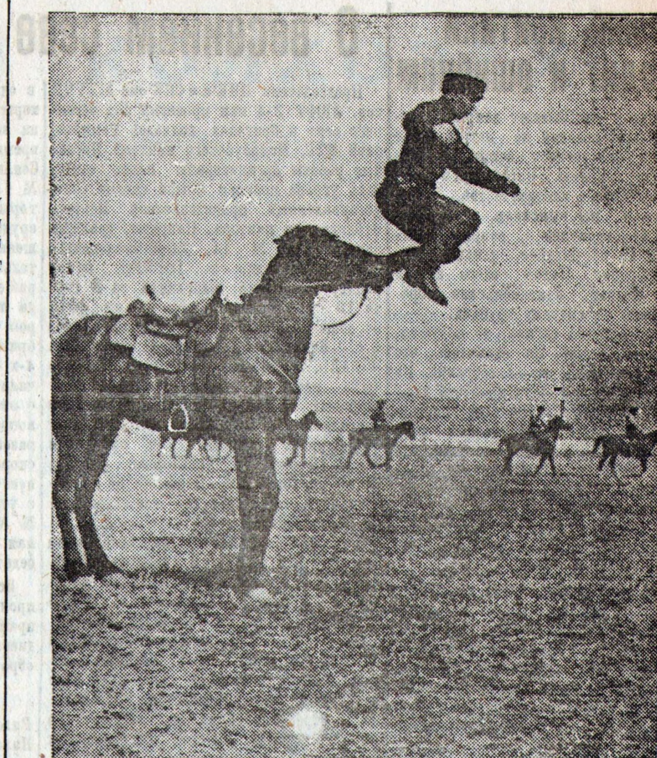
В начале мая в Пятигорске начался краевой народный праздник всех народов Северного Кавказа. Это будет мощная демонстрация дружбы народов края. На праздник придут гости — донские и кубанские казаки.

В Чаньшуйской группе алтайского приискового управления открыт кочиносовского ключа разведчиками открыт богатый золотой прииск «Талонский ключ».