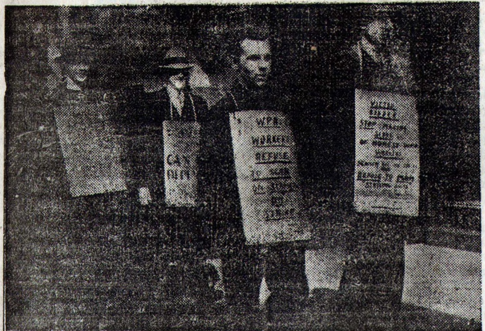
Забастовка американских моряков в знак протеста против увольнения нескольких матросов... На снимке: пикет забастовщиков в Нью-Йорке.