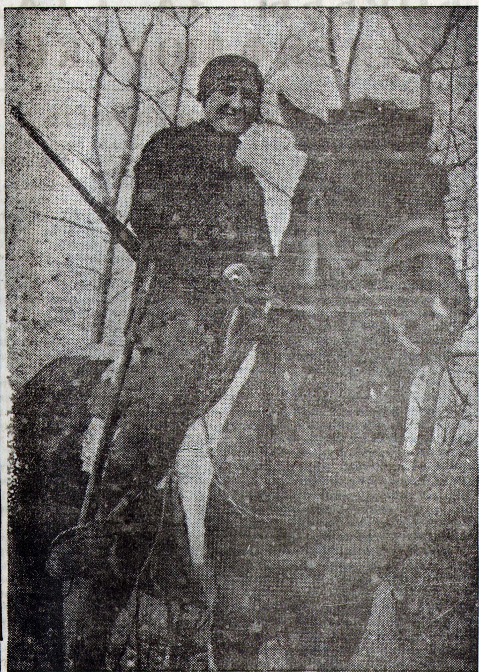
Движение за смену норм на „Воронцовского всадника“ увлечет все большее количество трудящихся молодежи.

Сердобск. Колхоз „Красный пахарь“ Сокольского сельсовета усердно развивает подсобные отрасли хозяйства.