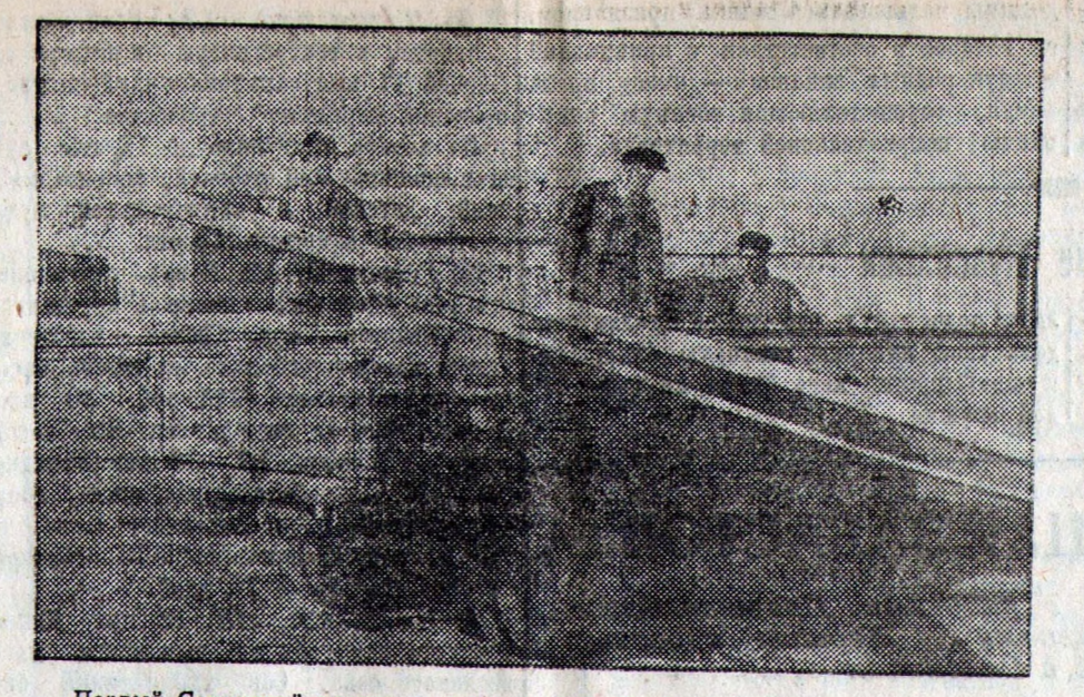
Первый Савинский колхоз еще во время сева начал подготовку к сено и хлебоуборке, закуплено заготов и леса на 800 руб. для ремонта лобогреек. На снимке: на колхозном грузовике привезли стволь лес для ремонта лобогреек.