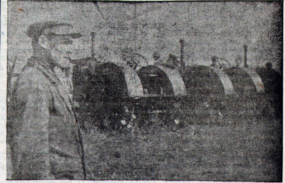
Комсомольская бригада № 21 Красноярского кантона. Орденосец тов. Шрейнер наблюдает за тракторами.