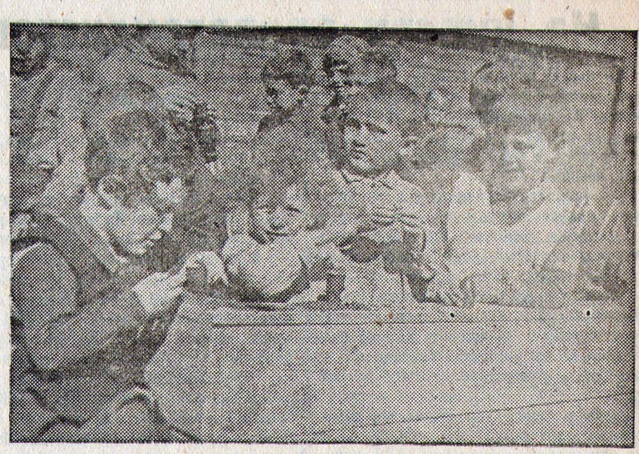
Детплощадка „Красный Октябрь“ (Энгельс). На снимке: дети за игрой в песочном ящике.

Архангельск, 12. В Архангельский порт 11-го мая из Мурманска прибыл ледокол „Литке“, который доставил на буксире „Малыгина“. Буксирную судна, лишенного рулевого управления, сквозь льды Белого моря „Литке“ провел блестяще. В Архангельске „Малыгин“ станет в доковый ремонт, а „Литке“ начнет готовиться к арктической навигации.